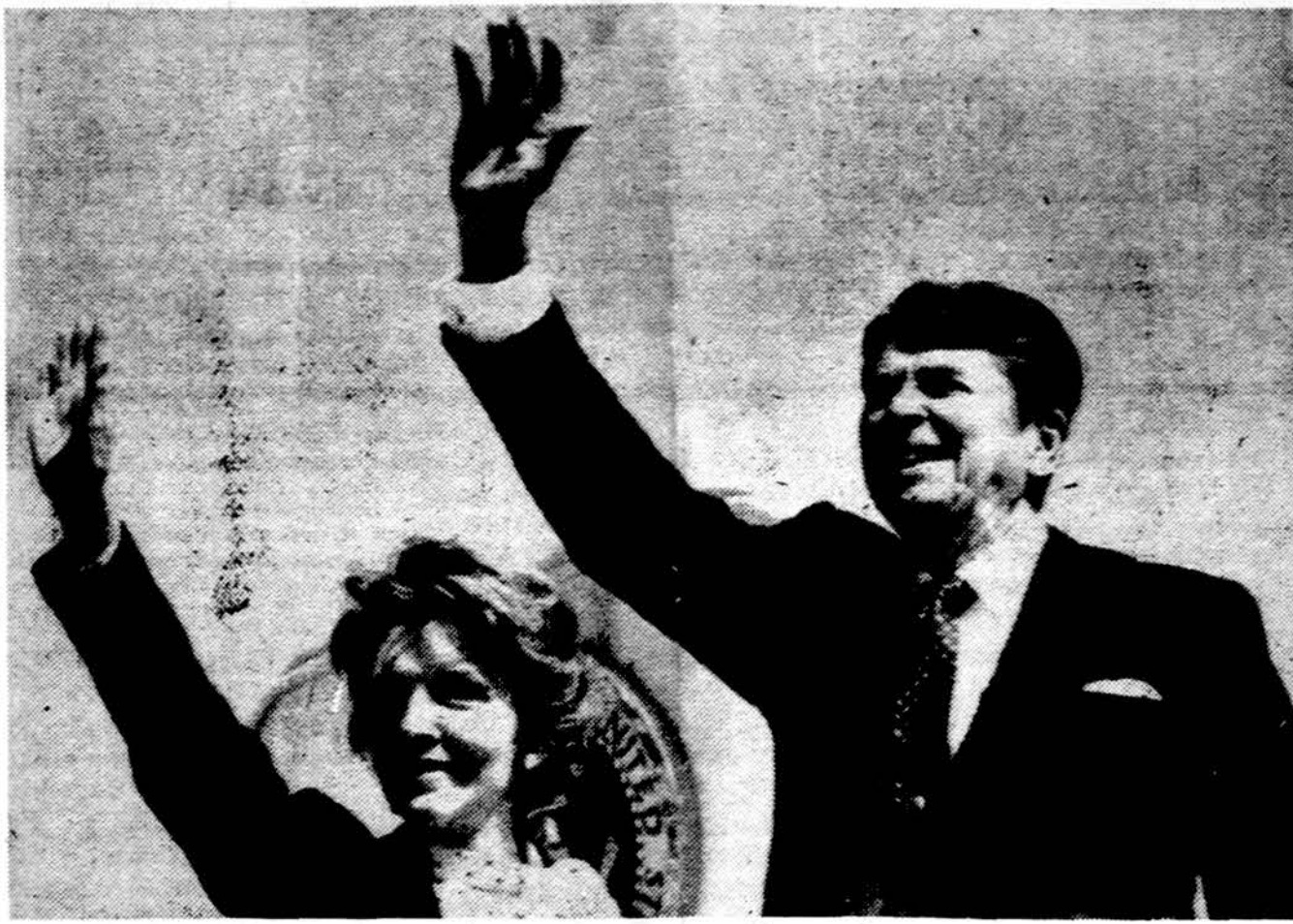
Amerikos Nepriklausomybės — Liepos 4 dieną — prezidentas Reaganas ir ponija Nancy Reagan ramiai praleido Camp David vasarvietę.

— Prieš atominis ginklus kovojanti taikos grupė paskelbė 12 respublikonų kongresmenų pavardes ir ragina balsuotojus išmesti juos iš Kongreso, nes jie nusistatę prieš ginklų kontrolę.