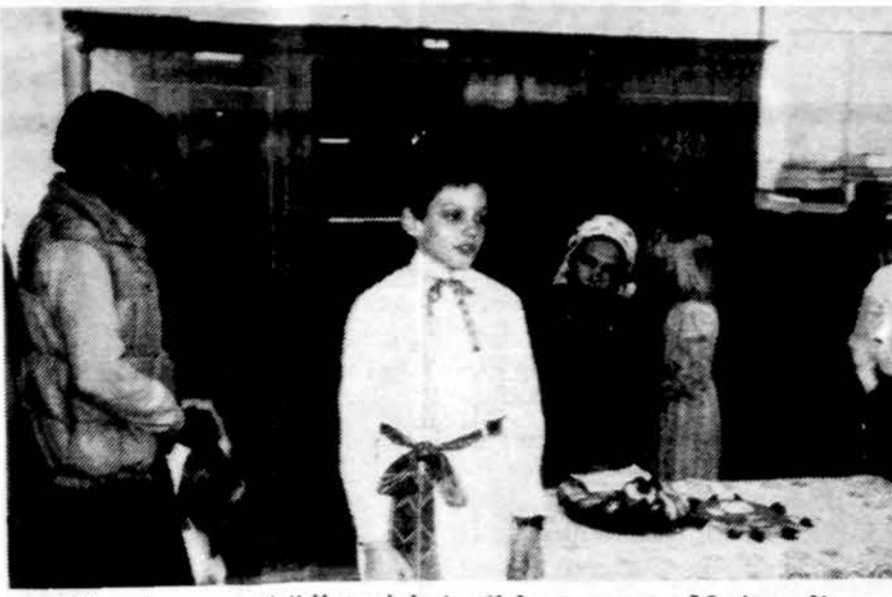
Miunchene mažieji lietuviukai atlieka programą Motinos dienos proga

Daug yra žmonių, bet daugiau veidų, nes kiekvienas žmogus turi daug veidų.