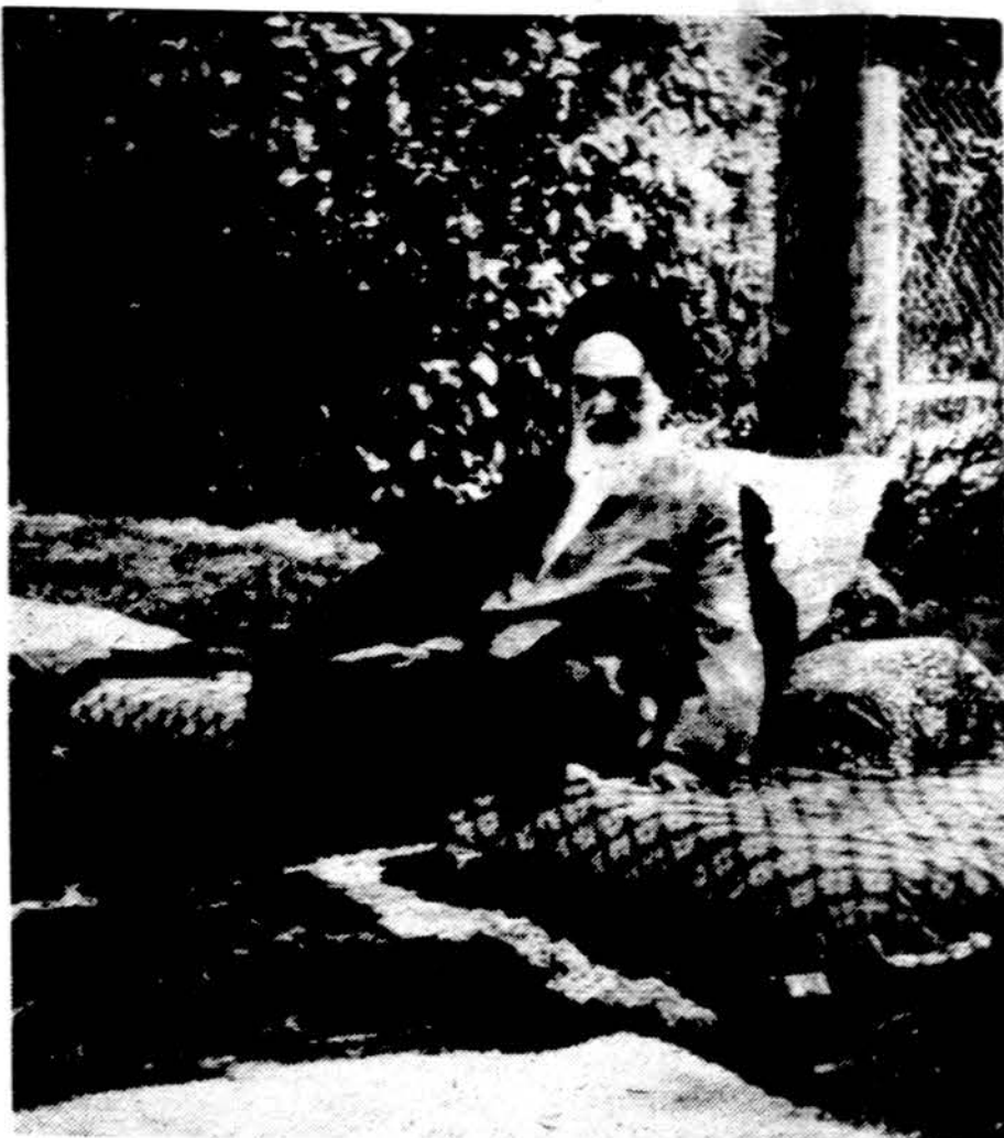
Irano dvasinis vadas ajatola Khomeinis pasakė ilgą kalbą, kurioje atmetė taikos su Iraku siūlymus. Ajatola įsakė kovoti, kol bus sunaikintas jo asmeninis priešas, bedievis Irako prezidentas Hussein. Manoma, kad netrukus prasidės nauja Irano ofensyva, kurioje vėl bus tūkstančiai neparuoštų persų jaunuolių.

— Armenų teroristų organizacija ASALA paskelbė Prancūzijoje ir Italijoje, kad ji persekios Los Angeles olimpinuose žaidimuose Turkijos sportininkus.