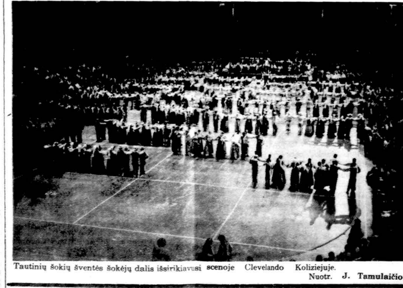
Tautinių šokių šventės šokėjų dalis išsiriakivusi scenoje Clevelando Kolizijeje.