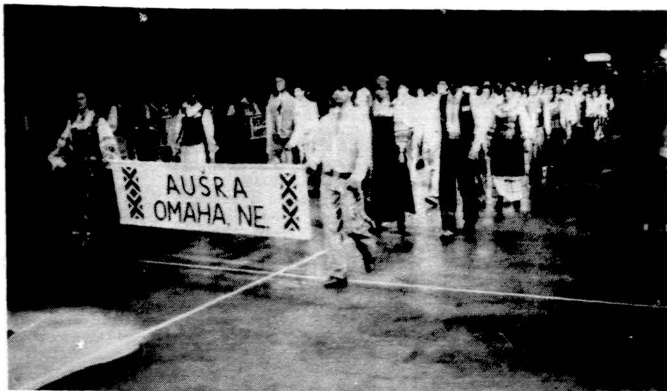
Omahos „Aušra“ žygiuoja į Tautinių šokių šventės sceną Clevelande Nuotr. J. Tamulaičio