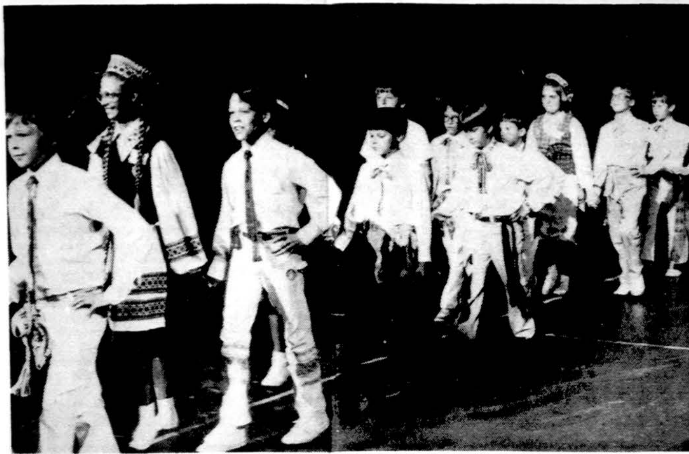
Chicago K. Donelaičio mokyklos šokėjai įžyguoja į Tautinių šokių areną Clevelande.

x Skubiai reikalinga lietuvių moteris namų ruošos darbams 3-jų asmenų šeimai gyvenančiai gražiame Chicago priemiestyje arti ežero. Geros gyvenimo sąlygos. Atskiras gražiai apstatytas kamb. Geras atlyginimas. Reikalinga mokėti angliškai susikalbėti. Kreiptis telefonu 835-5515. (sk.)