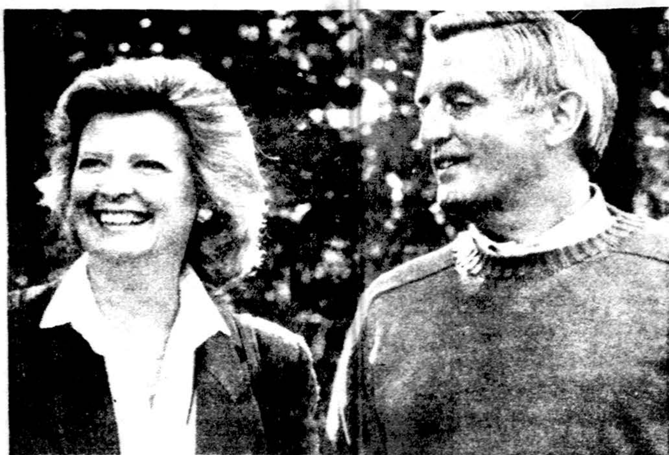
Kandidatą į prezidento vietą Walterį Mondalę aplankė Kentucky gubernatore Martha Layne Collins. Daug demokratų siūlo pasirinkti ją kandidatę į viceprezidento vietą.