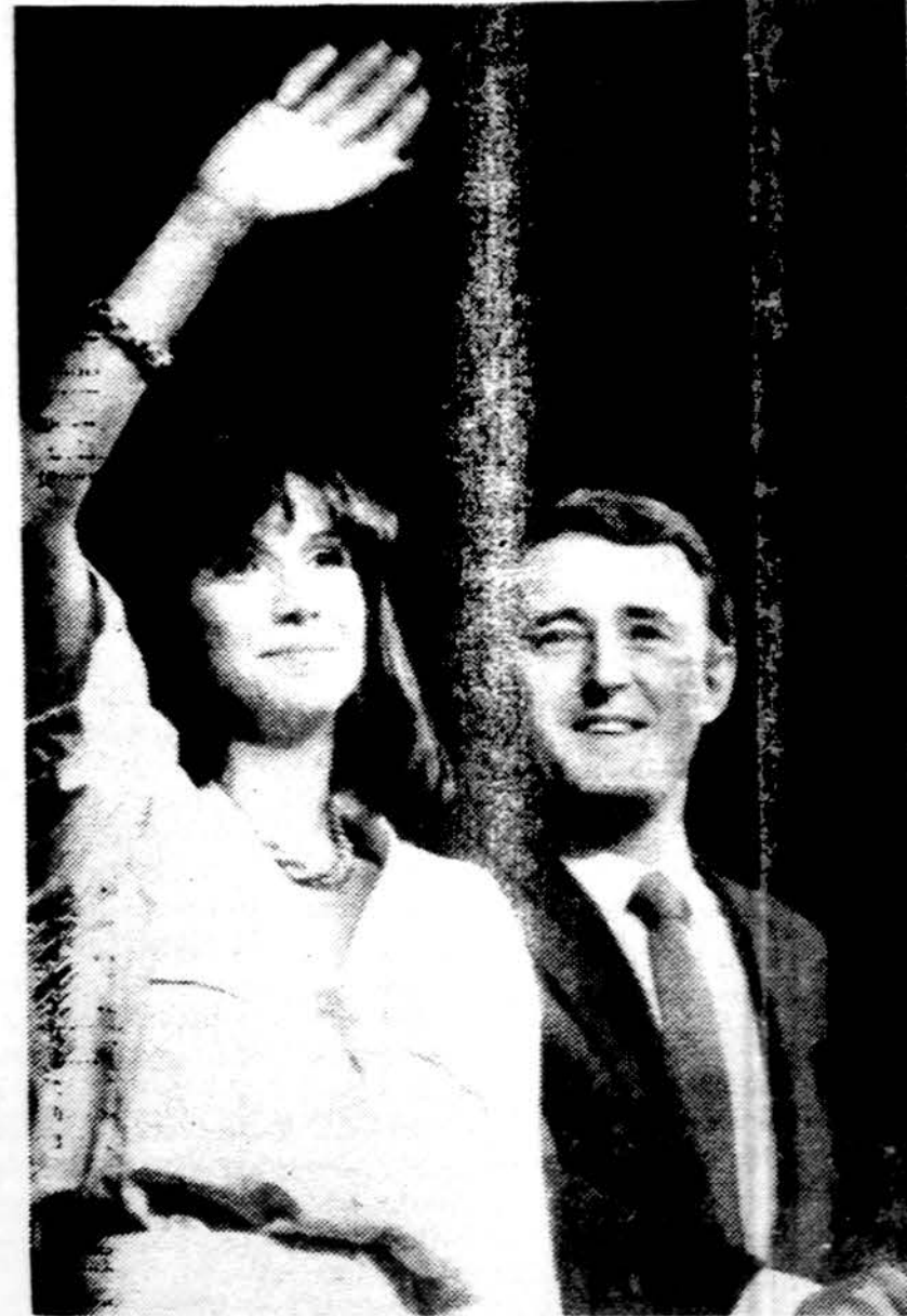
Kanados vyriausybė paskelbė naujo parlamento rinkimus. Jie įdomūs tuo, kad abi pagrindinės politinės partijos turi naujus vadus. Nuotraukoje pažangiųjų konservatorių pirmininkas, dabartinės opozicijos vadas Brian Mulroney su žmona Mila.

Žurnalas „Beijing Review“ rašo, kad nereali ir negalima laukti, kad Sovietų Sąjungos-Kinijos santykiai sugrįžtų į buvusią draugystę. Svarbiausia problema ta, kad sovietai mus nori kontroliuoti, o mes nenorime leisti kontroliuojami. Pagal Kremliaus logiką, tu esi geras ir revoliucionierius, jei visiškai laikais jo linijos, tačiau jei neklausai, pasidarei blogas, tam pat kontrevoliucionierius ar menkų akiračių nacionalistas, rašo kinų žurnalas.