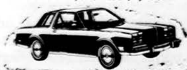
Chrysler LeBaron Medallion 2-dr. Coupe

PIRKDAMI NAUJUS AR VARTOTUS AUTOMOBILIUS SUTAUPYSITE NUO $300 IKI $1,000