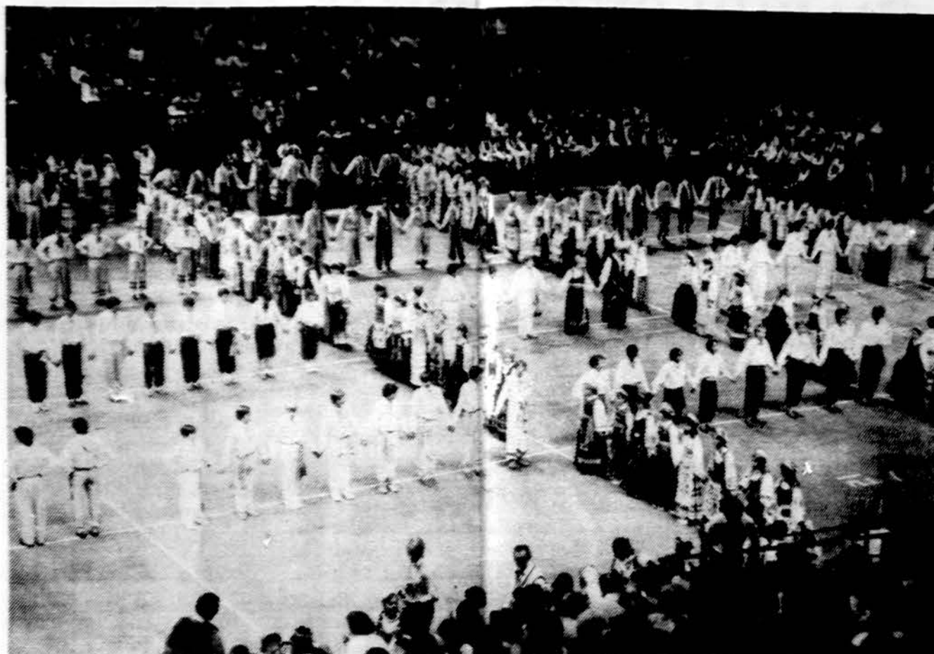
Vaidas iš Tautinių šokių šventės, rikiuojantis šokių pradžia.