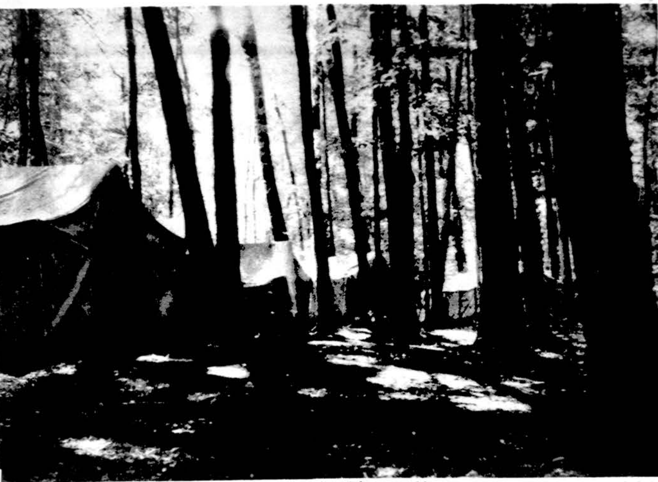
Pirmieji rytmečio saulės spinduliai lanko skautišką stovyklą.