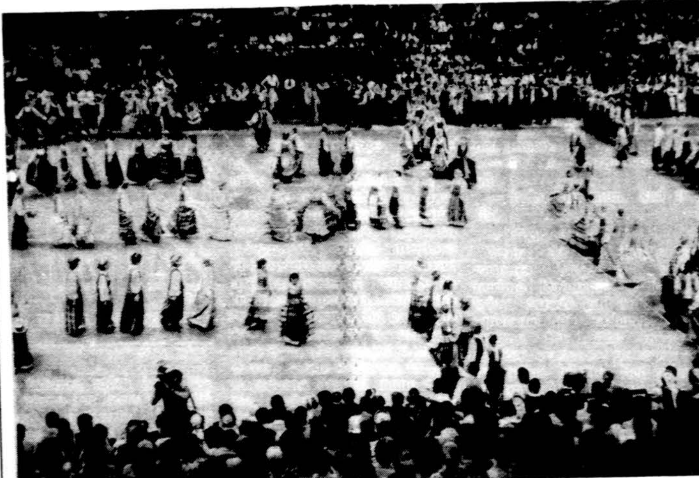
Vaidzas iš Lietuvos Tautinių Šokių šventės Clevelande liepos 1 d.