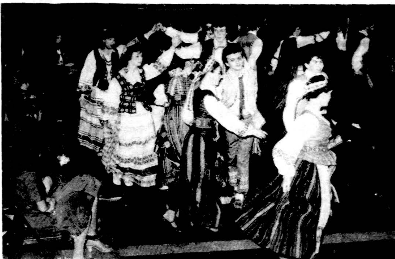
Smagu šokti ir žiūrėti tautinių šokių įkarštį, kai jaunieji atiduoda visus savo sugebėjimus.