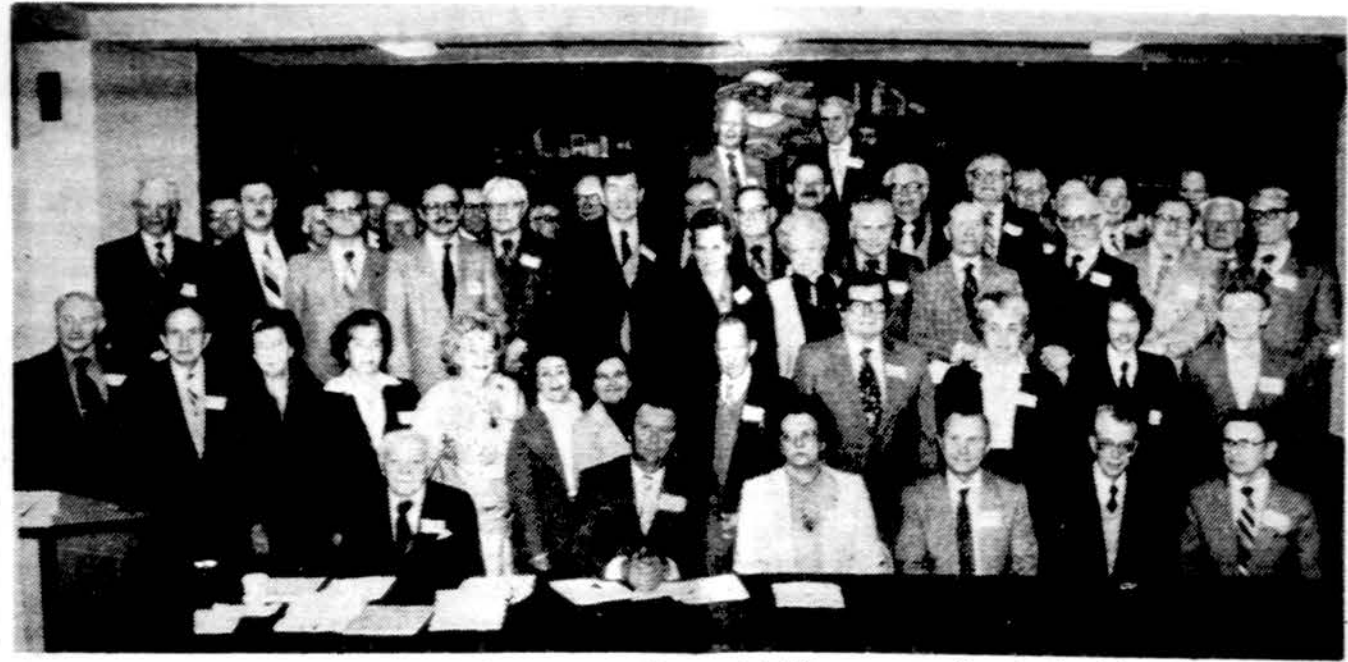
Lietuvių Bendruomenės Vidurio Vakarų apygardos susirinkimas su vadovybe ir atstovais. Nuotr. P. Malėtos