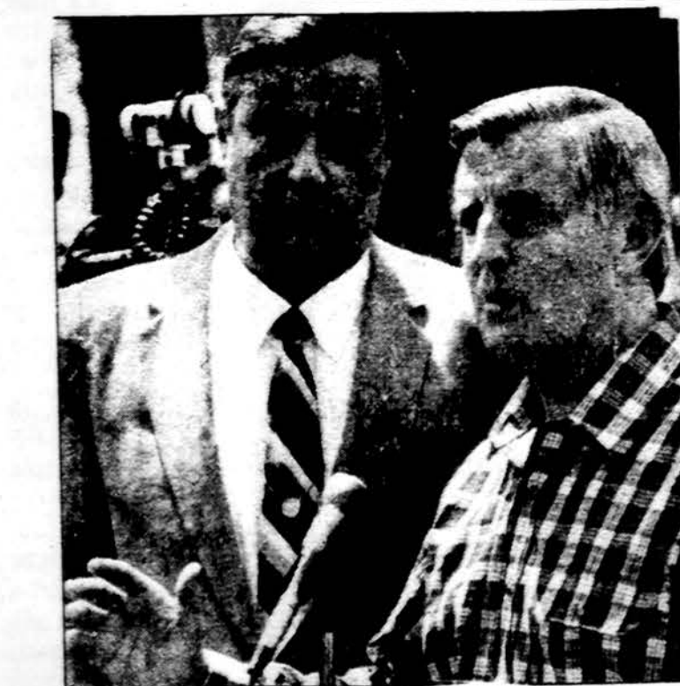
Pereitą šeštadienį Walter Mondale pranešė Lake Tahoe, Cal., kad buvęs Jimmy Carter finansų direktorius Bert Lance bus jo rinkiminės kampanijos vadovu.

— 6 žuvo lėktuvu nelaimėje netoli San Francisco. Pilotas, norėdamas išvengti susidūri-mo ore, vairavo lėktuvą toliau nuo automobilių aikštės, kai staiga lėktuvas sprogo, užmušdamas 6 lėktuve esan-čius žmones.