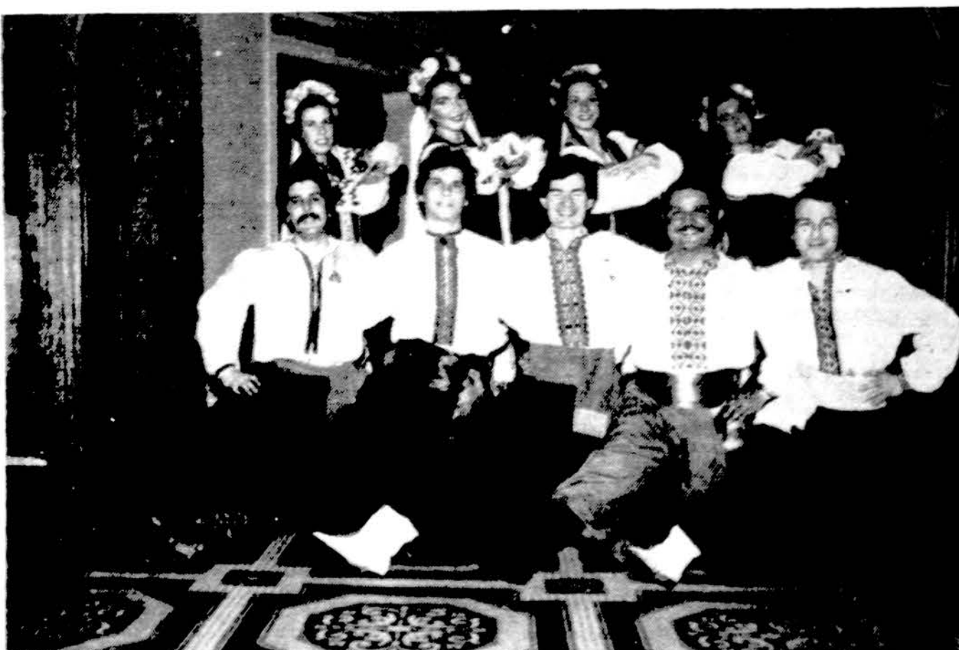
Ukrainiečių tautinių šokių šokėjai atliks programą Minkų vadovaujamos radijo valandėlės sukaktuvinėje gegužinėje.

Apie moką skelbtis dien. DRAUG, nes jis plačiausiai skaitomas lietuvių dienraštis, gi skelbtinų kainos yra visiems prieinamos.