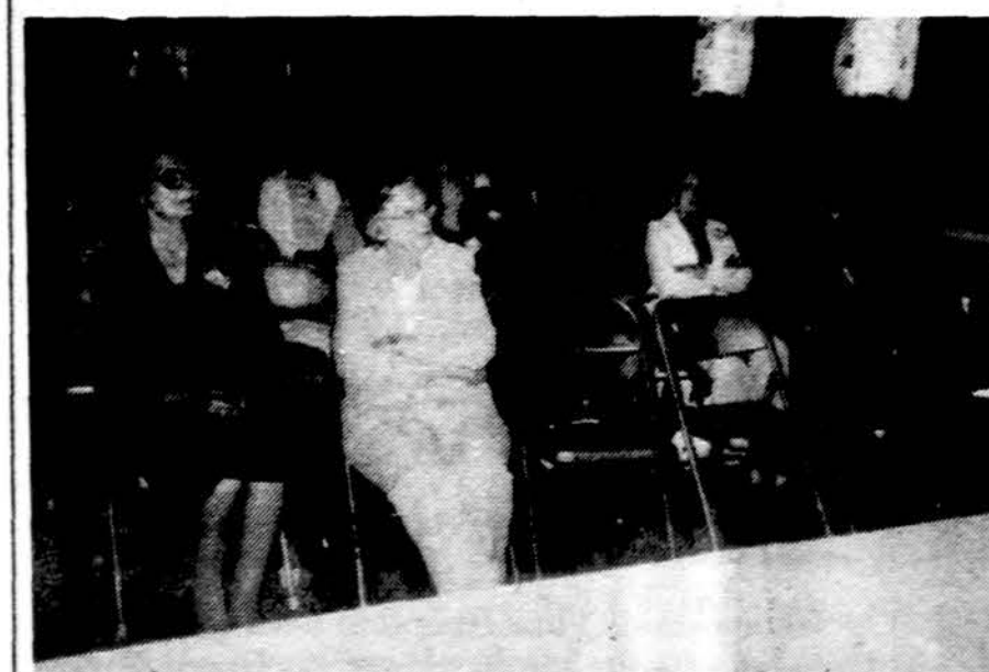
ALRK Moterų s-gos Connecticut apskrities metinis suvažiavimas