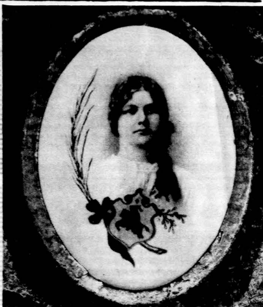
A. a. Petronelės Laurinaitės paveikslas paminkle Šv. Kazimiero kapinėse.