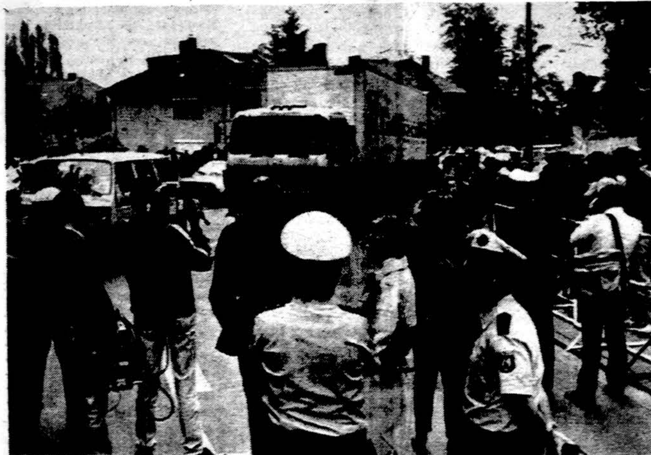
Sovietų sunkvežimiai, sustoję prie savo ambasados Bonoje. Po patikrinimo, jis išleidžiamas tolimesnei kelionei.