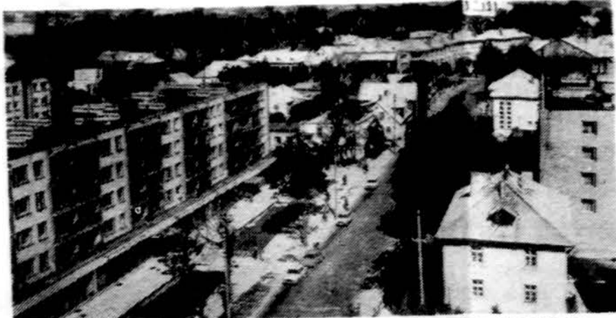
Biržų Vytauto gatvės pietinis galas, o toliau matyti katalikų bažnyčia su dviem baltais bokštais.