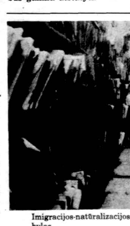
Imigracijos-naturalizacijos tarnautojas Manhatene varto bylas.

— Didžiojoje Britanijoje, JAV anglonų katedroje kilęs didžiulis gaisras beveik visiškai sunaikino šią vieną seniausių ir gražiausių ne tik Anglijos, bet ir visos Europos šventovių. Katedra buvo pradėta statyti 13-ojo amžiaus viduryje; ją kasmet aplankydavo apie du milijonai žmonių iš viso pasaulio. Gaisras katedroje kilo smarkios perkūnijos metu; manoma, kad ji sukėlė ir katedrą trenkęs žaibas. Tikimasi, kad katedrą bus galima atstatyti.