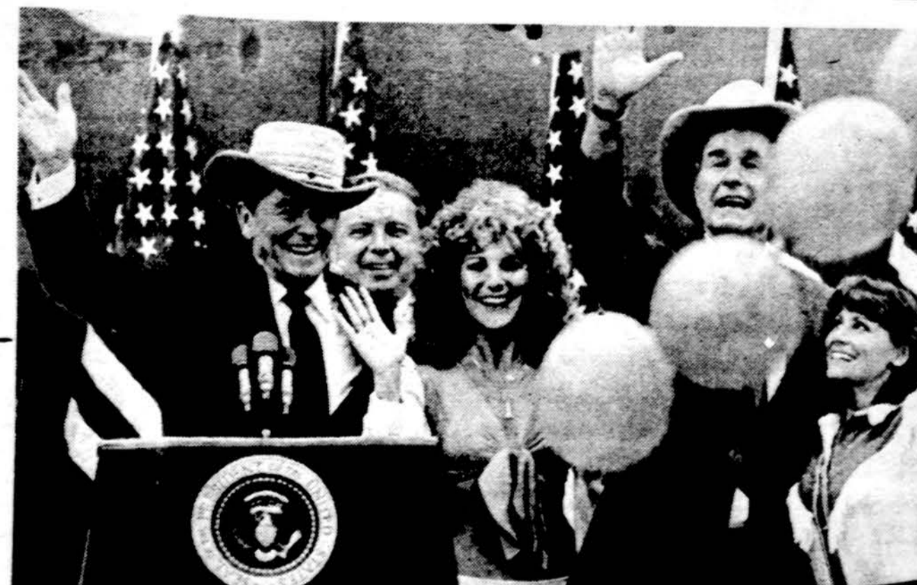
Prezidentas Reaganas ir viceprezidentas Bush dvi „cheerleaders“ dovanotas taksietiškas skrybėles, pradėdami savo rinkiminę kampaniją

Apsiniaukę, galimas lietus, Temperatūra dieną 70-75 l., naktį 65 l.