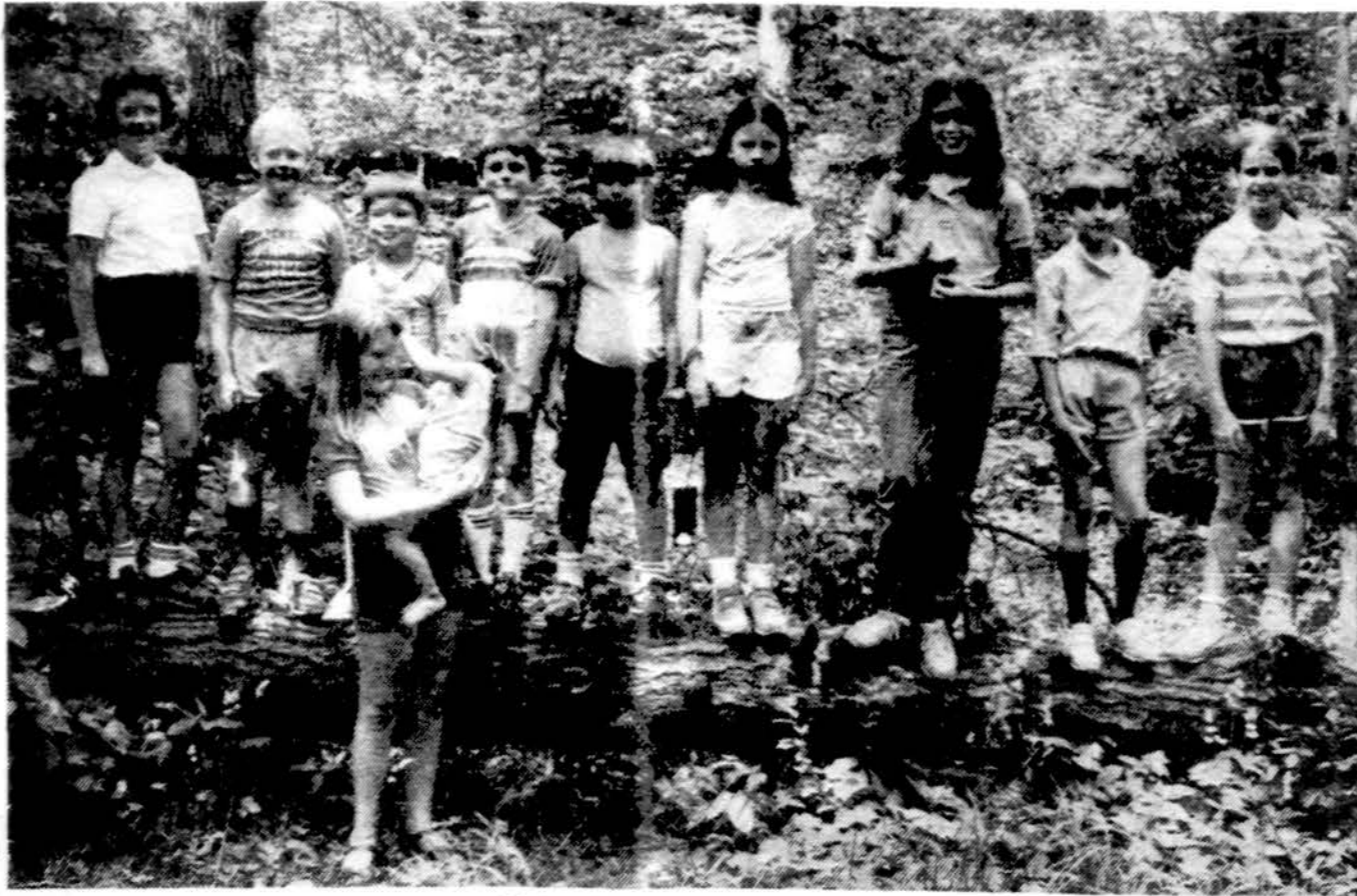
Siaurinių Chicago priemiesčių stovyklėlės dalis