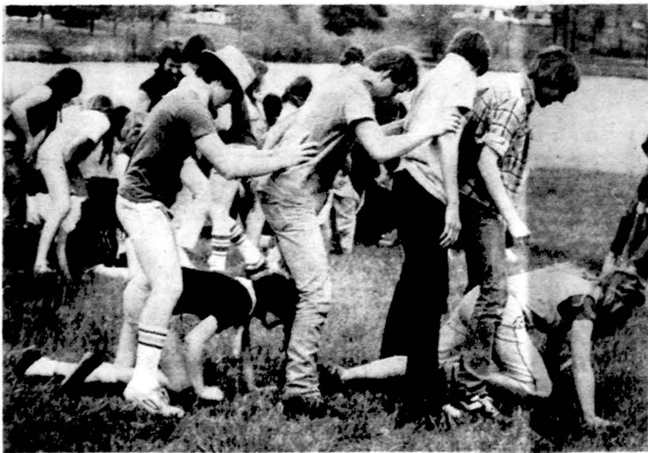
Skautų stovykloje žaidimais lavinamas vikrumas.

„Tačiau daugiau žiūrovų pritraukdavo ok. Latvijos šachmatininkai M. Talis ir A. Gipslis, nes šachmatai buvo labiau gerbiami nei šachės. Ne, nebuvo lyg visi būtų nusprendę, kad: „Šachmatai šaunesnis žaidimas, negu šachės“. Ne, taip sovietinė santvarka įpiršo gyventojams. Prieš antrą pasaulinį karą Sovietų Sąjungoje šachmatai ir šachės buvo lygiai gerbiami, nes sovietai dar nebuvo dalyvavę tarptautinėse varžybose. Po karo šachmatininkams pasitaikė progų žaisti užsienyje, o šachmatininkams dar ne; ryšium su tuo buvo pradėta žiūrėti garbingumo nelygybė. Ir gyventojai pamatė, kad valdžiai mažiau rūpi šachės nei šachmatai, ir juos labiau traukė šachmatai.“