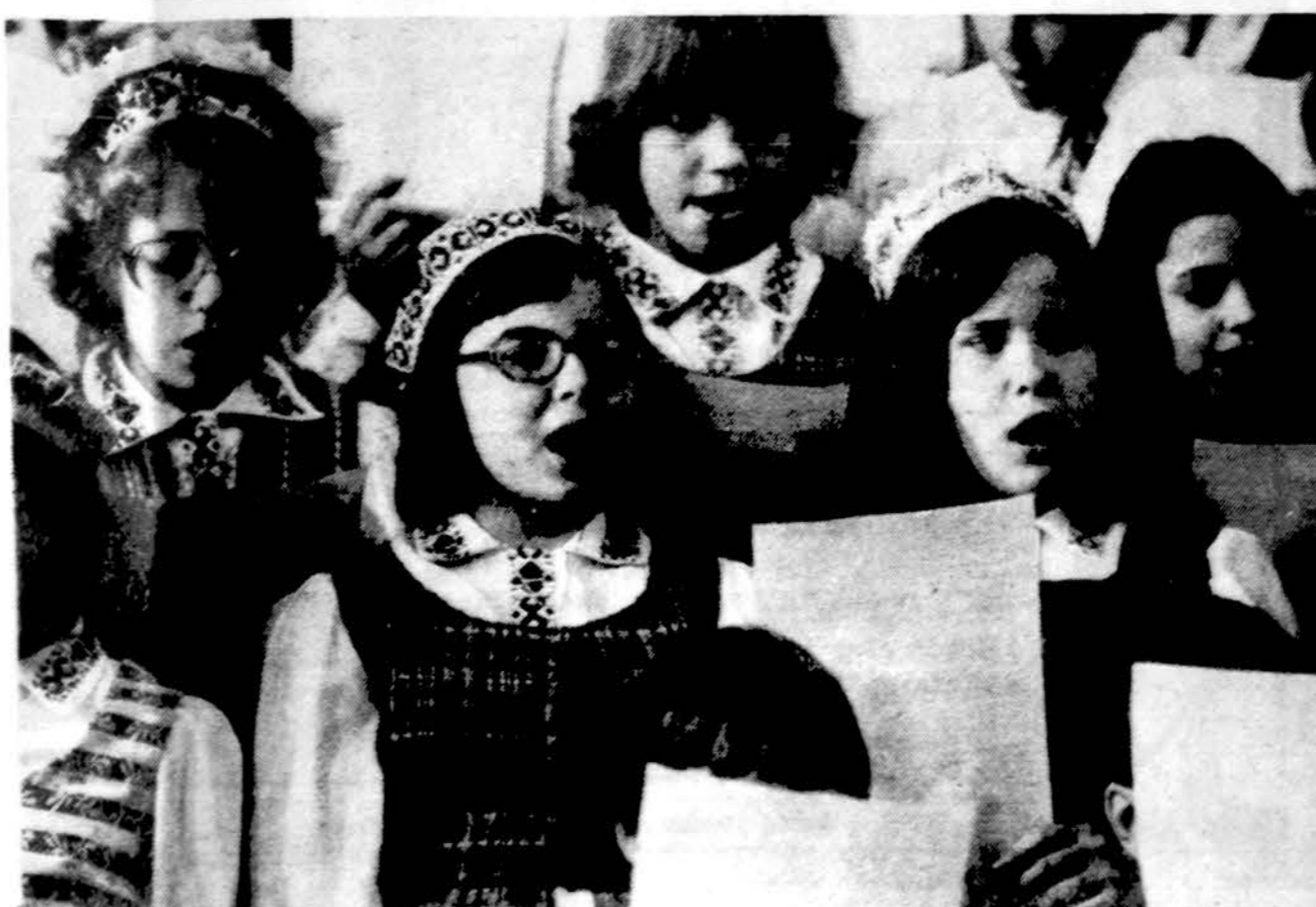
Dariaus ir Girėno liuanistinės mokyklos mokinės dainuoja

Chicagoje mažėja vaikų. Šešiose parapišose mokyklose Bridgeporte 1979 m. buvo 1,201 moksleivis, o 1984-85 mokslo metais tebus tik 820. Todėl vykdomas mokyklų suglaudinimas. Vykęs pamokos Šv. Antano, Marijos Nuolatinės Pagalbos ir Švč. M. Marijos parapijose. Šv. Dovydo ir Nekalto Prasidėjimo par. mokyklose vyks priešmokyklinis auklėjimas. Šv. Jurgio (lietuvių) parap. mokykla taps mokyklų bibliotekų ir kompiuterių centru.