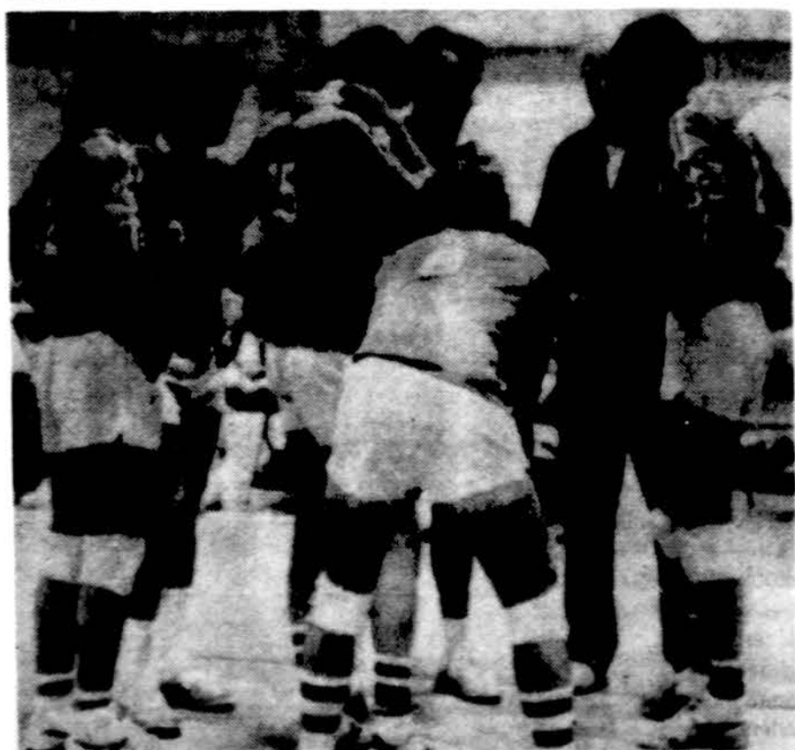
Lietuviai tinklininkai Laisvės olimpiadoje Toronte pertraukus metu aptaria savo žaidimo strategiją.

Sprendra himnas, taip pat ir bendrą rytmiškų judesių sistemą, turėtų būti atliekami visuose tarptautiniuose sporto