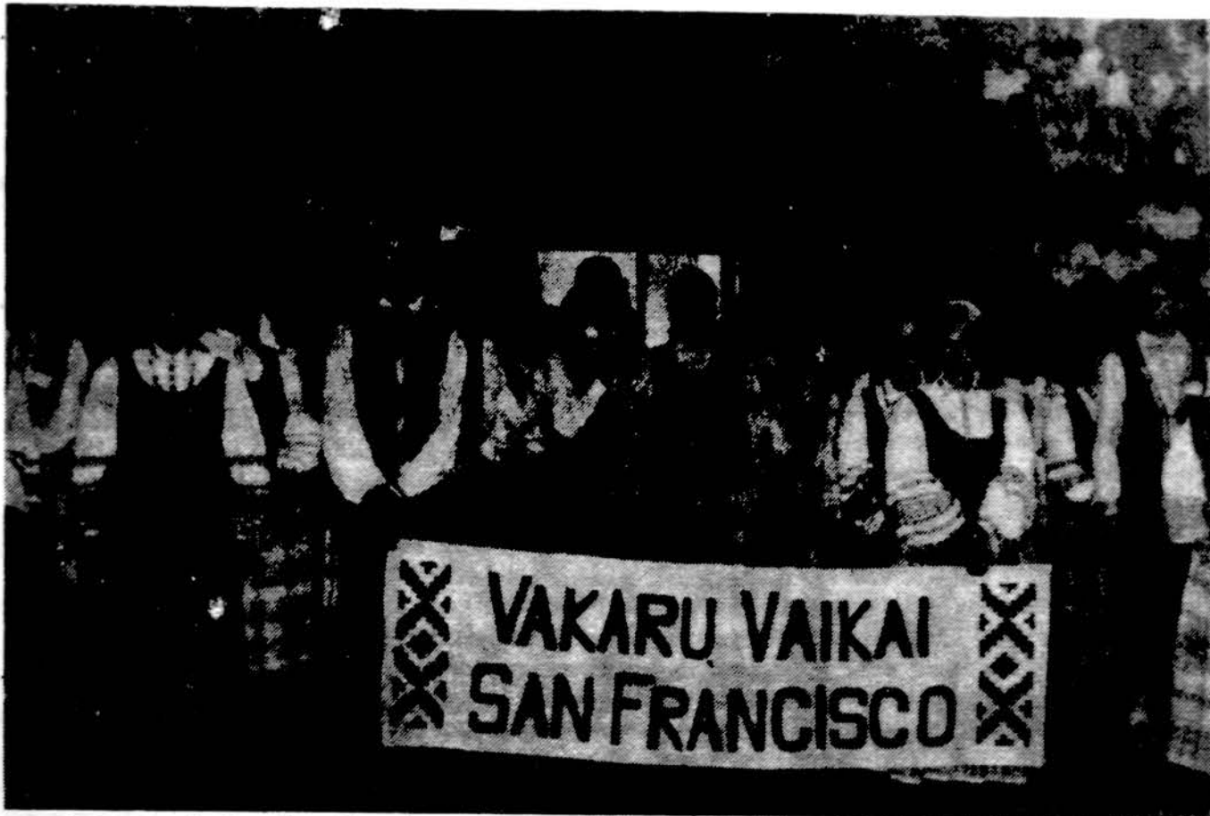
Vakarų vaikai — San Francisco tautinių šokių grupė Tautinių šokių šventėje Clevelande.