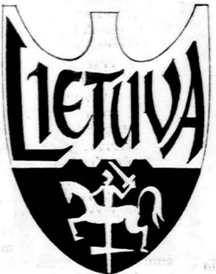
Kanados lietuvių sportininkų Laisvės olimpiados dalyvių ženklas, sukurtas A. Kulpos.

II-ji Laisvės olimpiada birželio 23 — liepos 7 dienomis vyko Toronte, Kanadoje. Joje dalyvavo 400 išeivijos lietuvių, latvių, estų ir ukrainiečių sportininkų. Lietuviams atstovavo 110 sportininkų iš įvairių JAV-ų ir Kanados vietovių. Lietuviai atrodė gražiai ir tvarkingai savo tamsiais žaliomis uniformomis su geltonų juostų papuošimais ir vyčių kairėje pusėje.