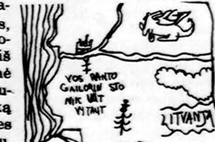
Straipsnio „Istorinė Apyaksa“ iliustracija. Piešė Darius Udrys.

Rūta kasmet atostogų metu nuvažiuodavo pas senelius. Ji buvo susidraugavusi su senelių kaimynų vaikais. Jie lankydavo po senelių didelį sodą ir žaisdavo visokius žaidimus. Vieną sekmadienį seneliai išvažiavo į svečius. Jie žadėjo grįžti tik po vakarienės. Apie trečią valandą pradėjo lyti. Pradžioje vaikai nuo lietaus slėpėsi po medžiu, bet pradėjus griauti ir žaibuoti, jie įbėgo į vidų. Ieškodami užsieniemo, vaikai užlipo į pastogę. Viename pastogės gale, tarp dėžių, jie pastebėjo senovišką skryniją. Vienas dėžes pastūmė į šalį, per kitas perlipę, vaikai priėjo prie skrynios ir ją atidarė.