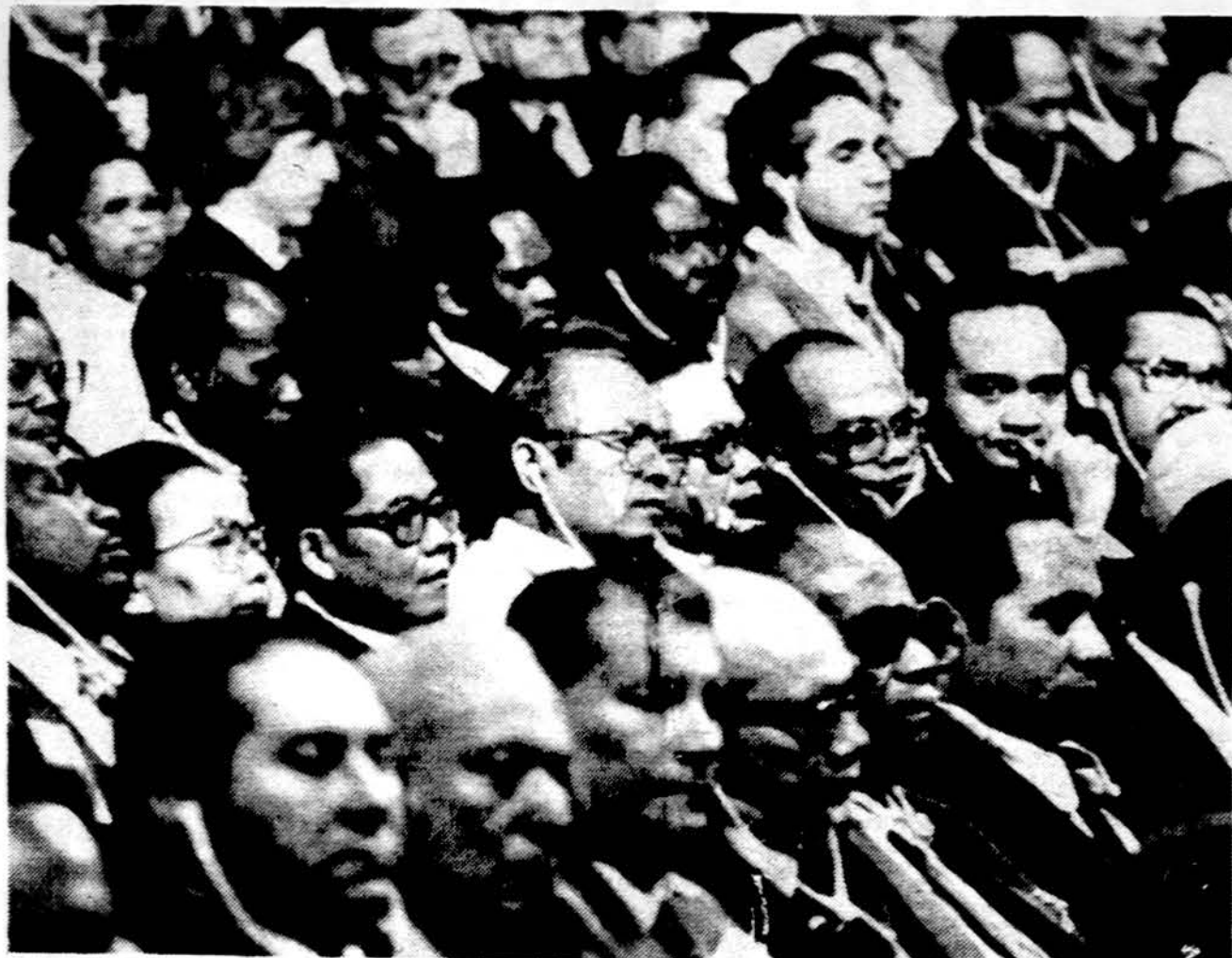
Meksikos mieste prasidėjo Jungtinių Tautų konferencija, kuri dvi savaites kalbės apie žmonijos augimo keliamas pasaulio problemas. Ši „International Conference on Population“ išgirdo, kad gimimų skaičius pralenkia technikos pažangą, nekais paverčia ekonominį augimą. Šimtmečio gale pasaulyje bus apie 600 milijonų žmonių, kurie badaus ir gyvens skurde.

— Indija pasirašė sutartį su Sovietų Sąjunga, kuri paduos Indijai naujus karos lėktuvus Mig-29. Indijos lakūnai važiuos į Sovietų Sąjungą pasimokyti tuos lėktuvus valdyti.