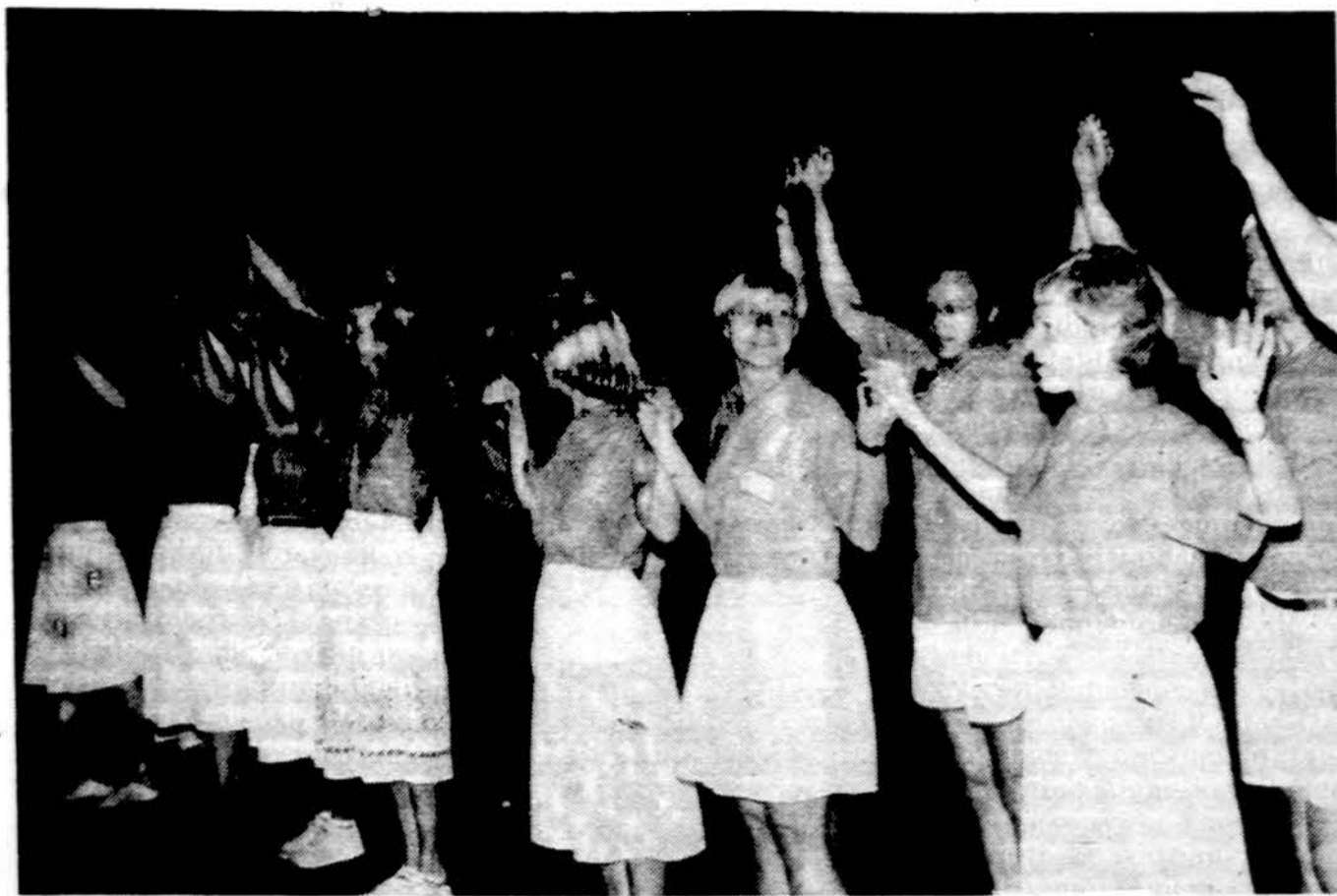
Šokėjos ir šokėjai pradeda plastinius pratimus