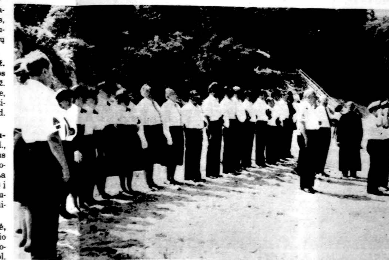
Šaulių gretos Michigano ežero pakrantėje žuvusių Lietuvos laisvės kovose karių ir šaulių apeigose, liepos 29 d. Union Pier, Mich.