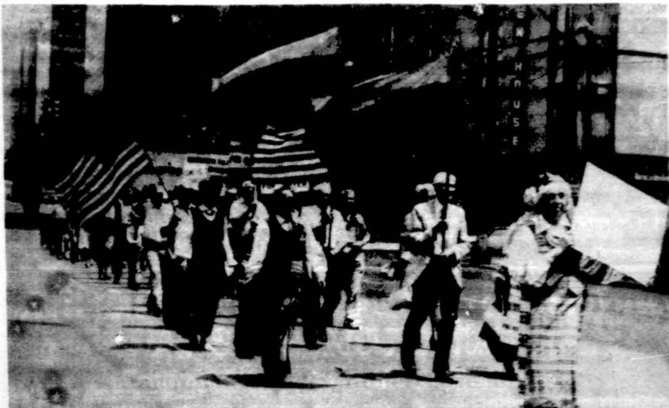
Pavergtųjų tautų minėjimo eiseną Clevelande.