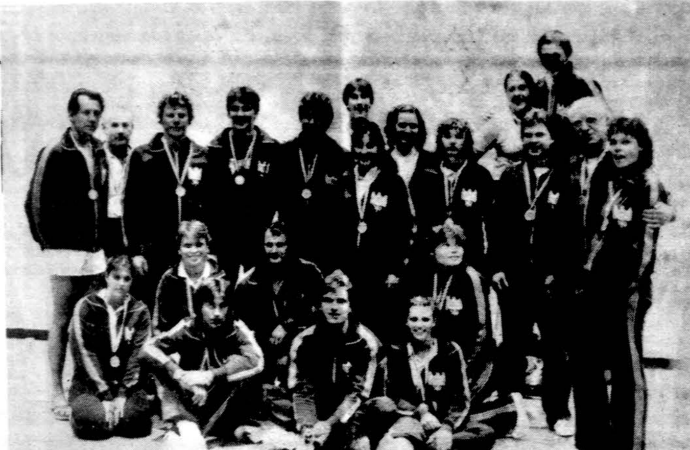
Lietuvių moterų ir vyrų tinklinio rinktinės, dalyvavusios Toronte įvykusioje II-je Laisvės olimpiadoje.