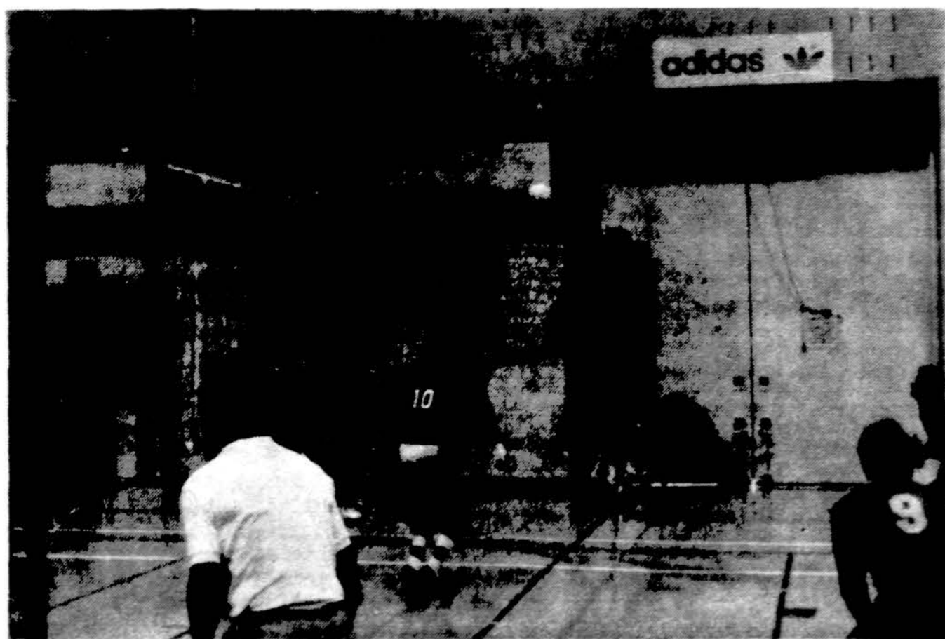
II-je Laisvės olimpiadoje lietuviai tinklininkai rungtyniauja su estais dėl bronzos medalio.