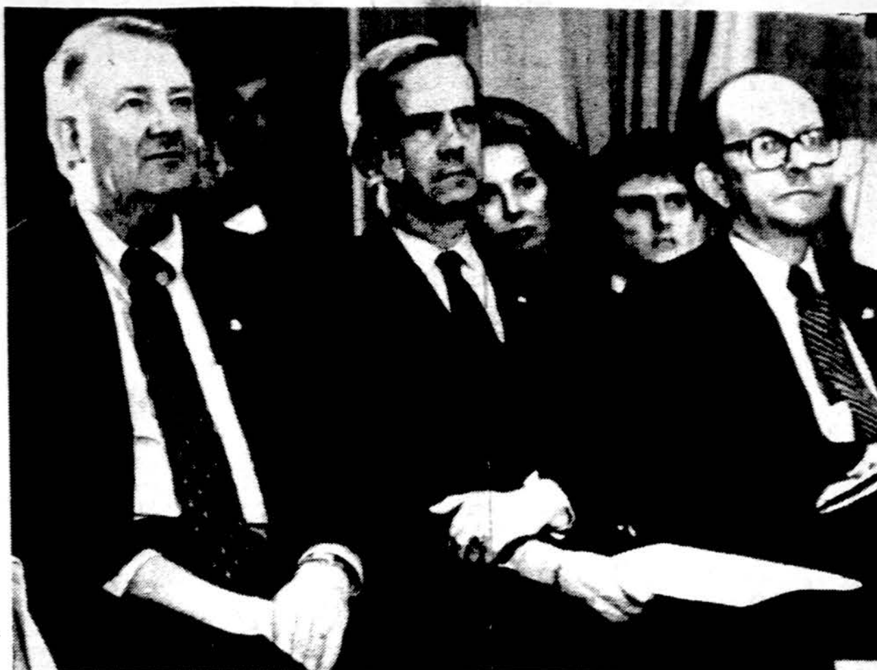
Trys svarbiausieji prezidento Reagano administracijos pareigūnai: prezidento patarėjas Edwin Meese, valstybės saugumo patarėjas Robert McFarlane ir Baltųjų Rūmų štabo viršininko pavaduotojas Michael Deaver. Respublikonų partijos platformos komitetas jau pradėjo svarstyti. Ateinančią savaitę Dallas mieste prasideda respublikonų partijos konvencija.

— Sovietų spauda paskelbė, kad sušaudyti keturi asmenys, kurie pernai bandė Gruzijoje pagrobti keleivinį lėktuvą su 59 keleiviais ir nukreipti jį į Turkiją. Lėktuve įvyko susišaudymas, 7 žmonės žuvo. Viena moteris nuteista 14 metų kalėjimu.