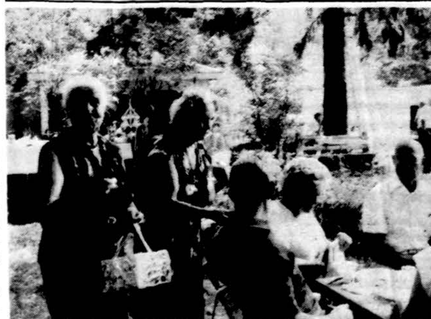
Union Pier lietuviai savo subuvime prie gražiai paruoštų stalų ir lietuviško valgio.

Mes visi skundžiamės, kad nėra laiko, o elgiamės taip, lyg jo turėtume begales. Seneca