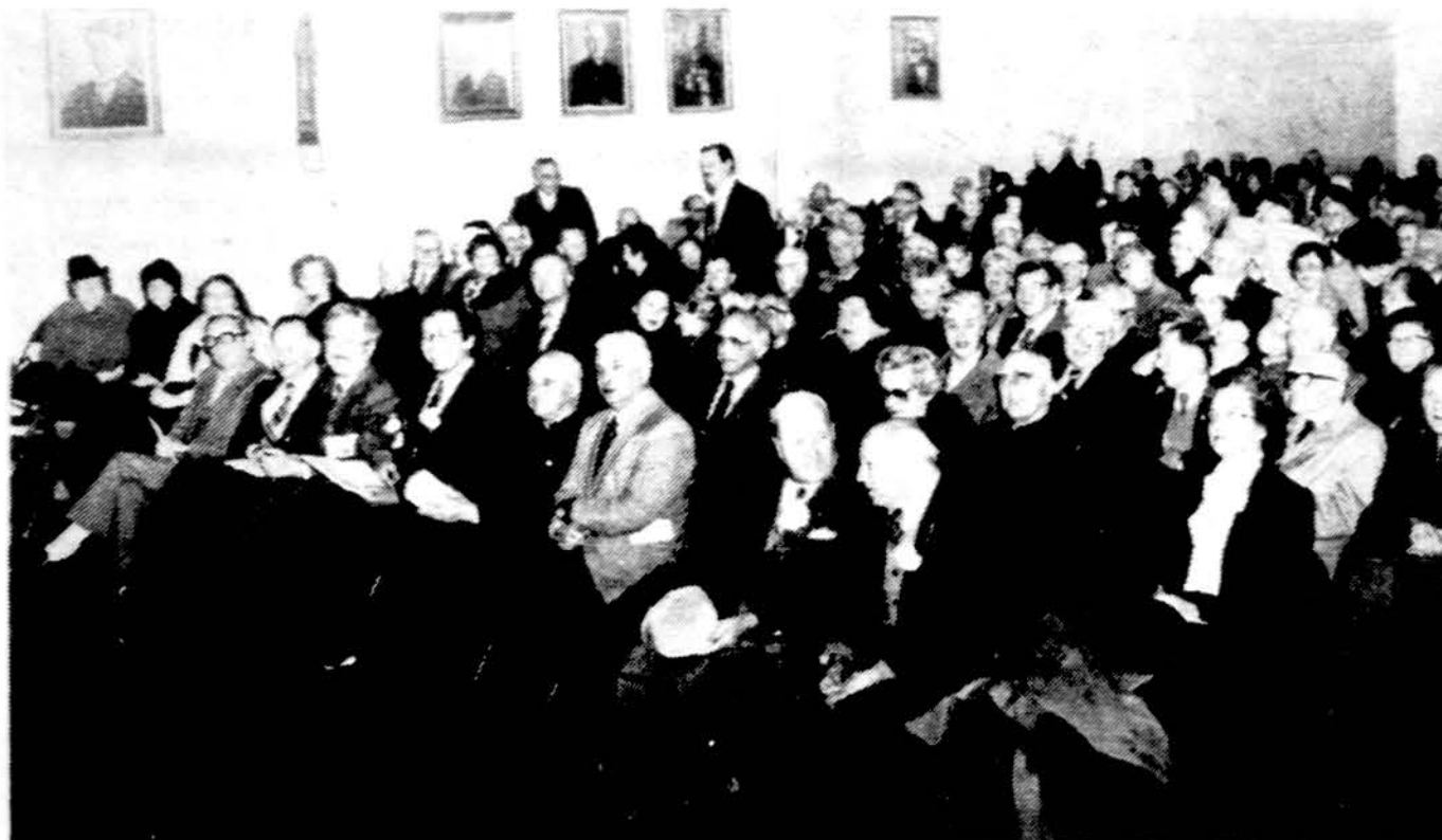
Lietuvių atstovai tariaisi Jaunimo centre tautiniams reikalais.