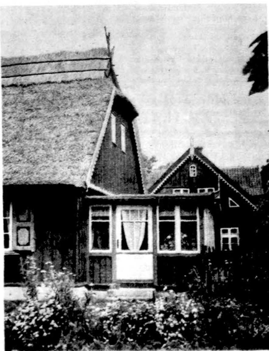
Lietuvos žvejo gyvenamojo namo fragmentas, Nida. Prieškarinė nuotrauka.