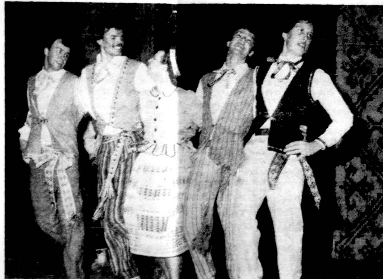
Tautinių šokių Grandies ansamblio šokėjai „šokimėlio“ sukūryje. Rugsėjo 13 d. Grandis pradeda registruoti naujus ir senus šokėjus.