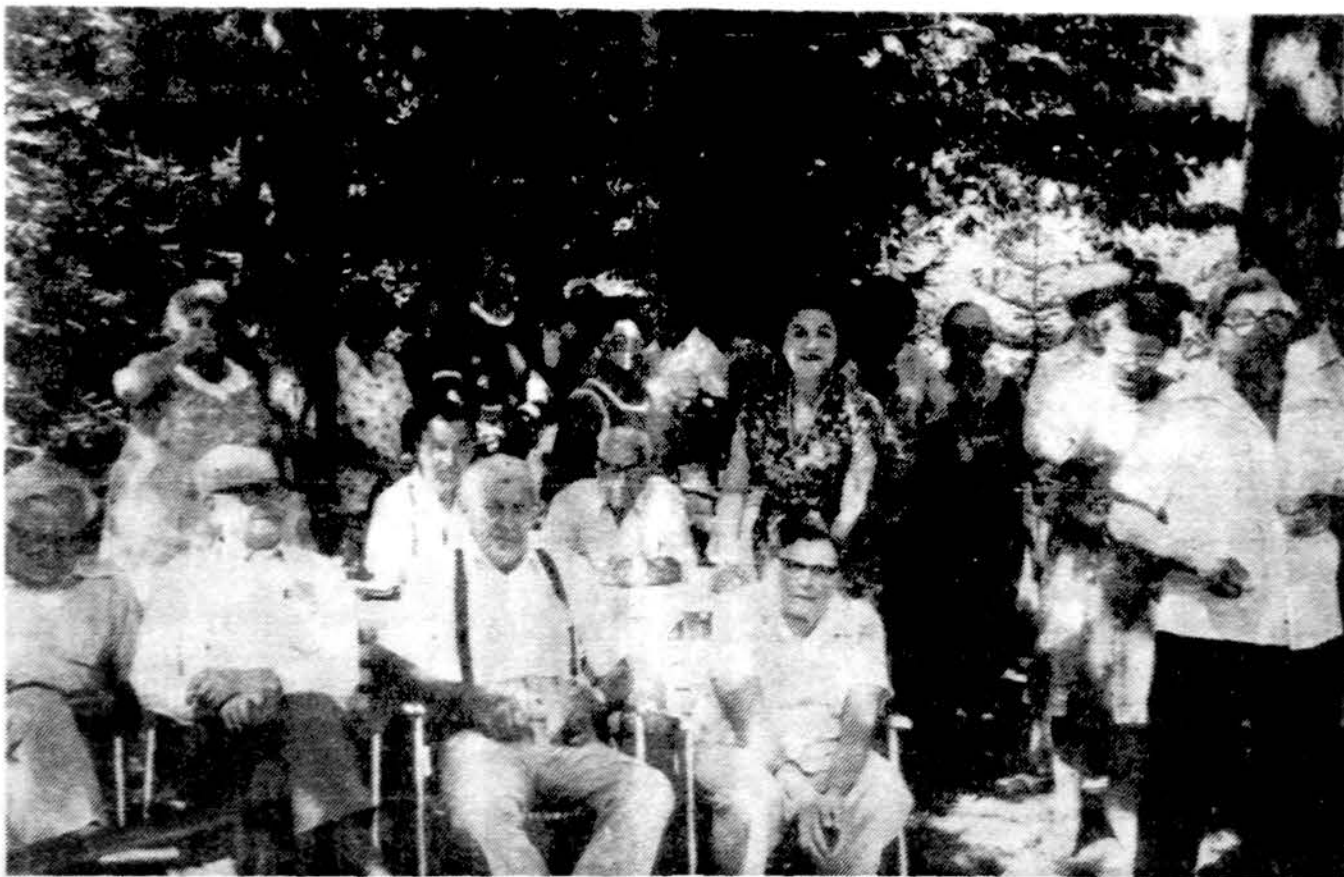
Detroito St. Butkaus šaulių kuopos gegužinėje Vasiulių sodyboje.

Miglotą šeštadienio rytą „Gabijos“ ir „Baltijos“ tuntu paukštytės, vilkiukai, aguonėlės ir dobiliukai rinkosi Kensington parke padraugauti ir pasidžiaugti vasaros gamta. Nuėjus į ūkio centrą, smagu buvo matyti šokinėjan-