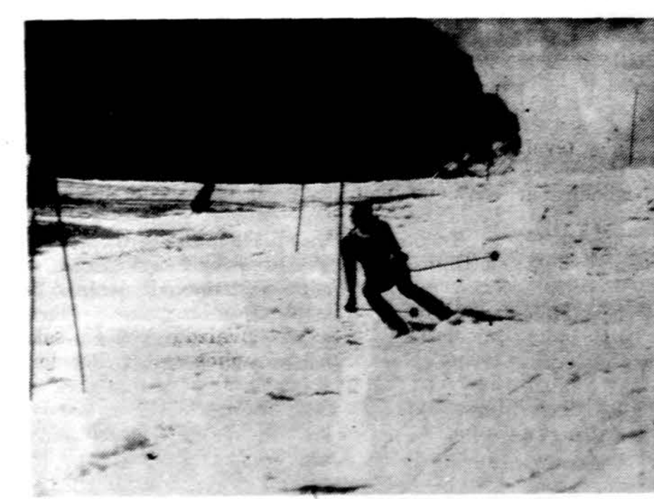
Australietis Algis Vaitiekūnas slalomo varžybose rugpjūčio 4 d. Australijoje vykusiose žiemos sporto rungtynėse.