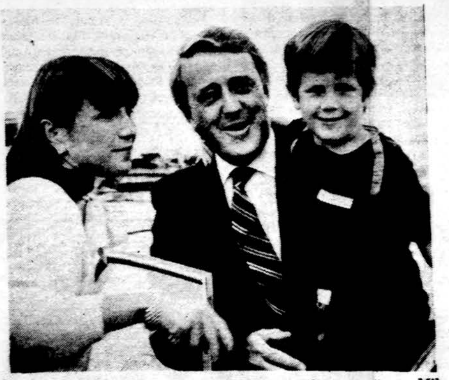
Kanados konservatorių partijos vadovas Brian Mulroney su žmona Mila ir sūnum džiaugiasi laimėjus parlamento rinkimus.

Jungtinių Tautų Saugumo Taryba respelbė, jog Pietinės Afrikos respublikos naujoji konstitucija priešinga JT chartai ir bus laikoma negaliojančia, nes neduoda balsavimo teisės juodiesiems piliečiams. Nuo balsavimo taryboje susilaikė Amerika ir Britanija.