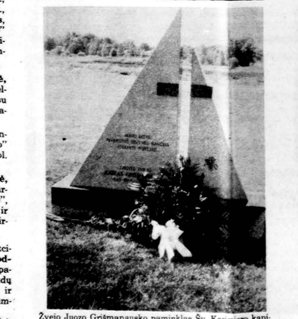
Žvejo Juozo Grišmanausko paminklas Sv. Kazimiero kapinėse, Chicagoje.