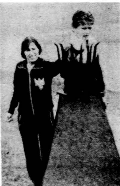
Laisvės olimpiadoje Toronte įžiebiamą olimpinę liepsną