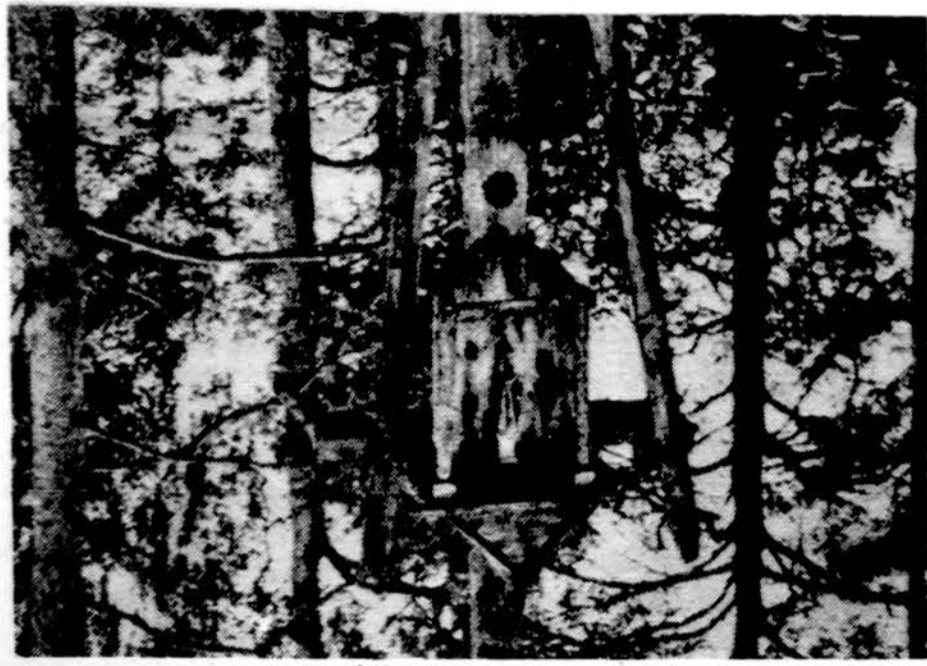
Koplytėlė prie kelio. Džukija.