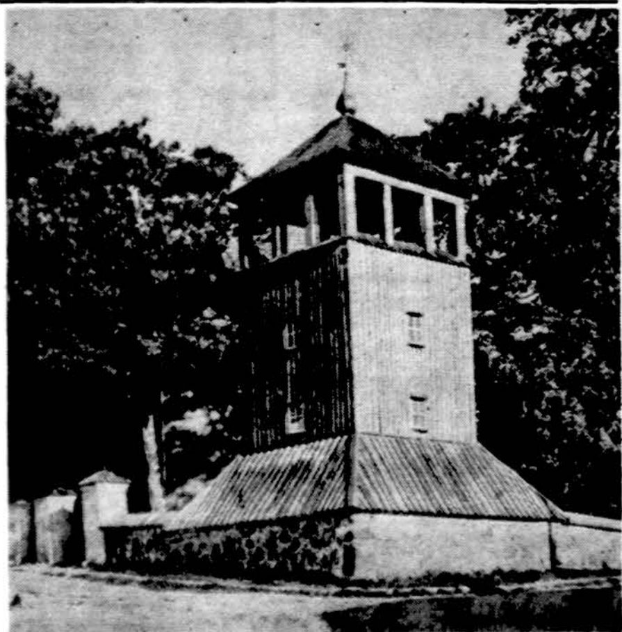
Platelių varpinė. 1939m. nuotrauka