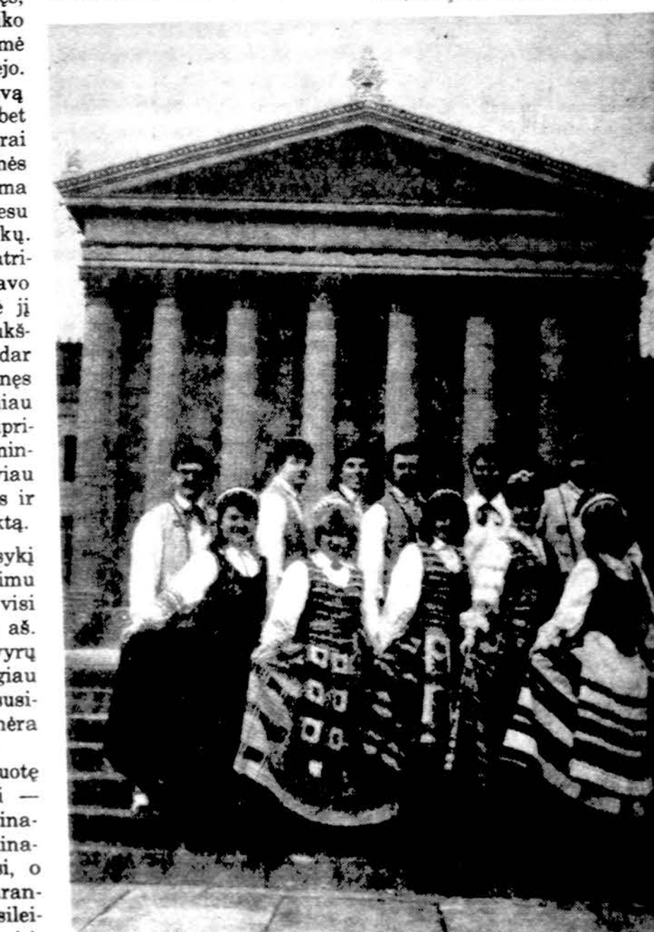
„Aušrinės tautinių šokių grupė iš Philadelphia, dalyvavusi šių metų Tautinių šokių šventėje.

gali nugalėti baimę, ieško atsakomybės ir kuriais galima pasitikėti. Mes esam parašiutininkai. Palinkėjo, kad šokant vis būtų skaidrus dangus, švelnus vėjelis ir minkštas nusileidimas.