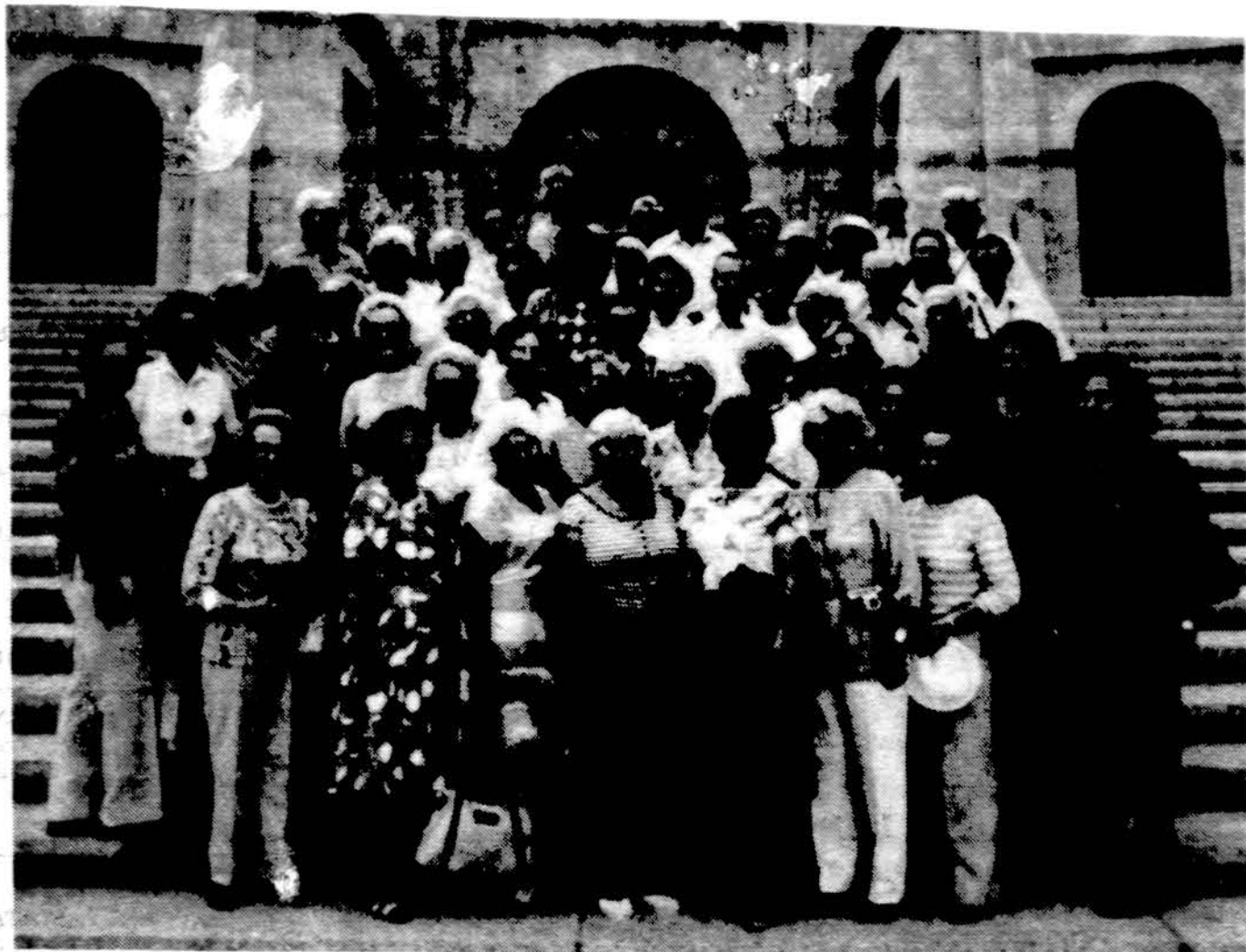
„Draugo“ suruoštos ekskursijos į Ispaniją, Portugaliją ir Prancūziją dalyviai prie Ispanijos viliniam kare žuvusių paminklo netoli Madrido.