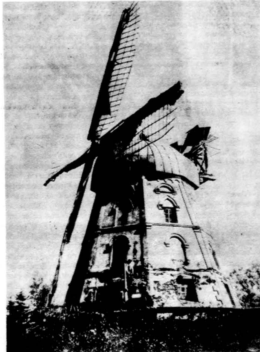
Baisogalos, Kėdainių aps., vėjinis malūnas. B. Buraco 1923 m. nuotr.