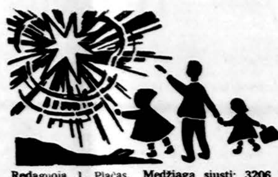
Redaguoja J. Placas. Medžiagą siūsti: 3206 W. 65th Place, Chicago, IL 60629

Field muziejus rugsėjo 29 d. nuo 1 iki 4 val. p. p. ruošia vadinamą Caribbean music festivalį visiems nemokamai.