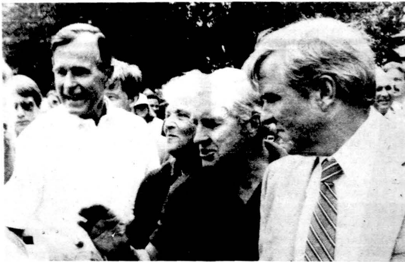
Viceprezidentas George Bush, jo žmona Barbara ir senatorius Charles H. Percy sveikinasi su Lemonto lietuviams Darbo dienos parade.