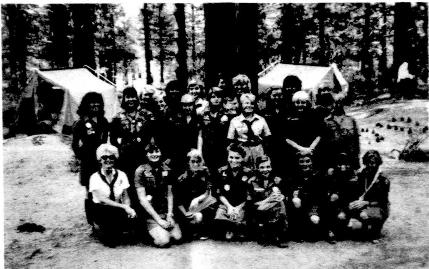
Los Angeles „Palangos“ tuntu skautės ir vadovės stovykloje.

Visos vienietų vadovės raginamos į kursus atsiųsti galimai didesni būrį vadovaujančių ir vadovausiančių sesių. Kiekvienam vienietui svarbu turėti pareigoms paruoštas seses. Būna liūdni rezultatai kai draugovei paskiriamas vadovauti visiškai be jokio tam darbu pasiruošimo vadovė. Nukentia ne tik vadovaujamas vienietas, bet kentia ir