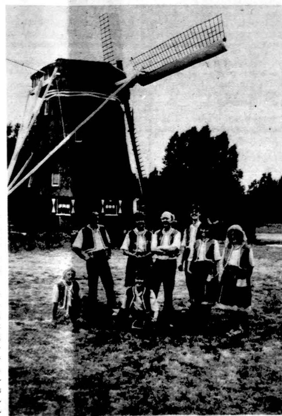
Lietuviškai dainuojantys olandai pasirodys Chicago Jaunimo centre spalio 14 d.

— Pabaltiečių Taikos ir laisvės laivo kelionė — 1985 rudenį. Daugiau žinių bus pranešta vėliau.