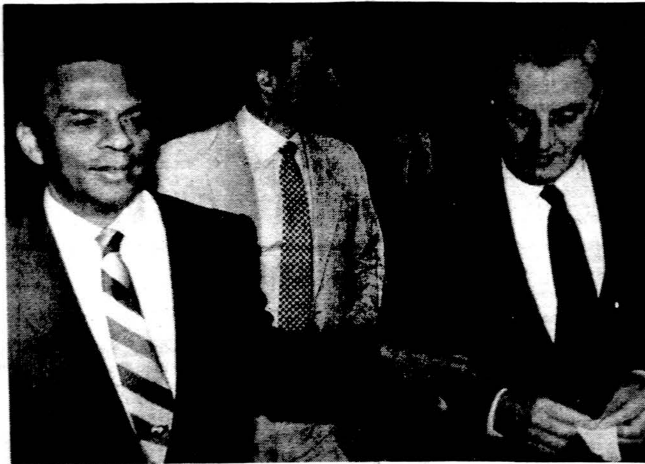
Demokratų partijos kandidatas ir prezidento vietininkas Walter Mondale nusiskundė, kad jį labai nedraugiškai sutiko Kalifornijos universiteto studentai, trukdė jam kalbėti, šūkavę prezidentą

— Sovietai perdavė JAV Pakrančių Sargybos laivui penkis Aliaskos jūreivius, kurie išbuvo suimti visą savaitę Sovietų Sąjungoje.