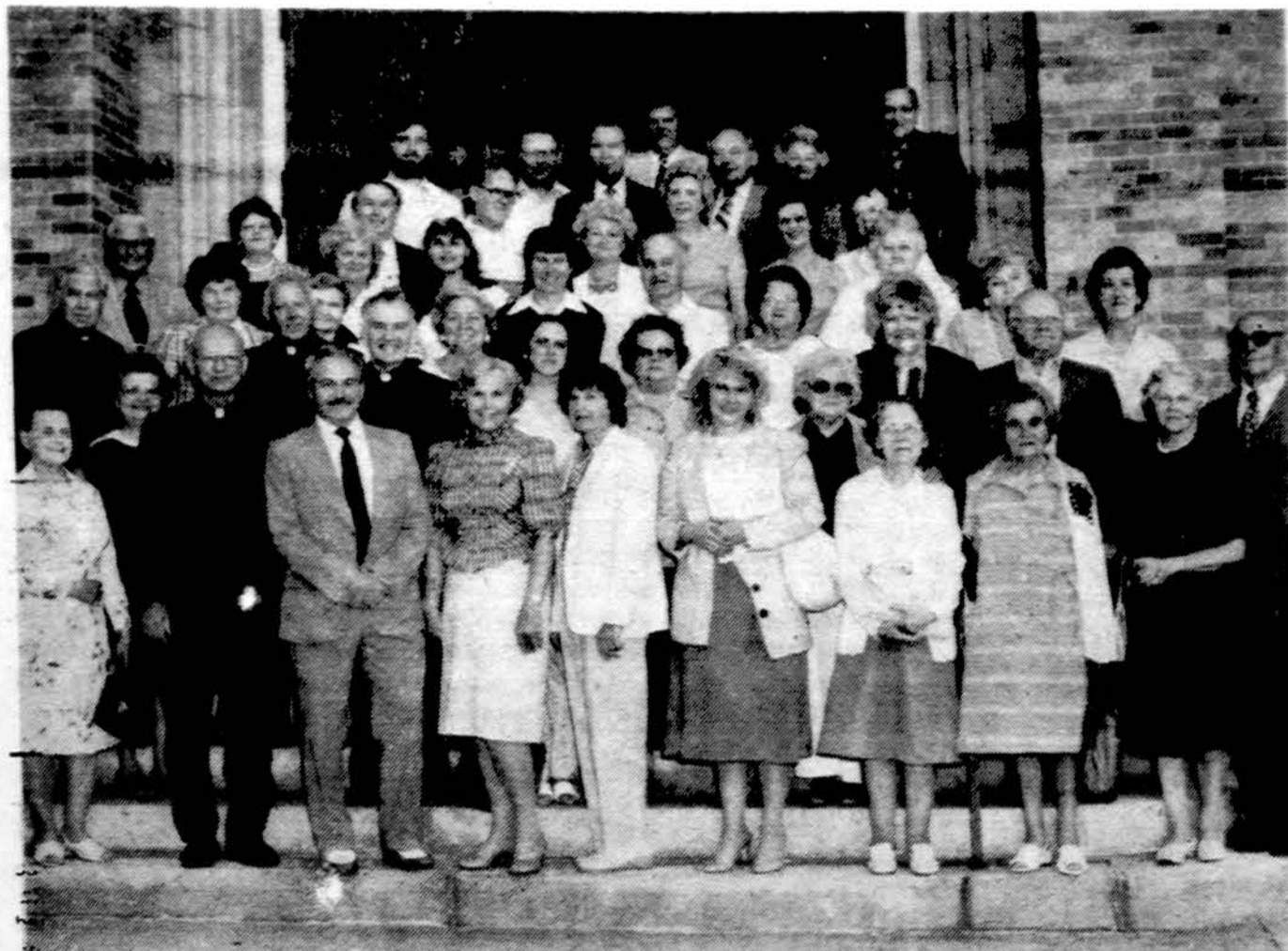
Šv. Kazimiero 500 metų nuo mirties jubiliejaus Bostone rengimo centro ir parapijų komitetų nariai prieš posėdį liepos 10 d. prie Šv. Pranciškaus bažnyčios Lawrence, Mass.

setts valstijos ir Bostono miesto pareigūnai. Išnaudokime šią progą ir pripildykime tą didelę katedrą net tik maldai ir pagerbimui Lietuvos patrono šv. Kazimiero, bet gausiu dalyvavimu parodykime valdžios atstovams, kad lietuviai yra masė, su kuria reikia skaitytis. Šio minėjimo komitetas deda visas pastangas, kad tik šis minėjimas gražiai ir reikšmingai praeitų.