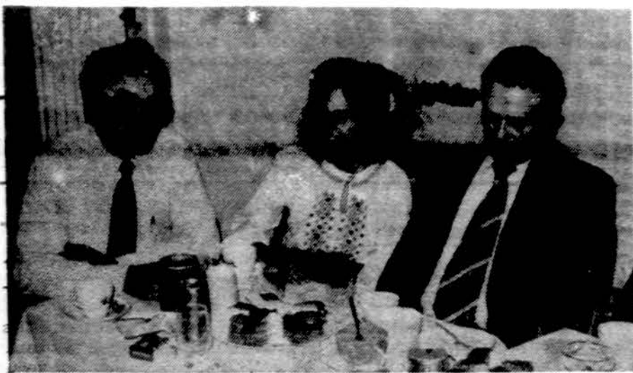
A. Kramilius, Kramilienė ir Ankus vieno Australijos ateitininkų pobūvio metu.