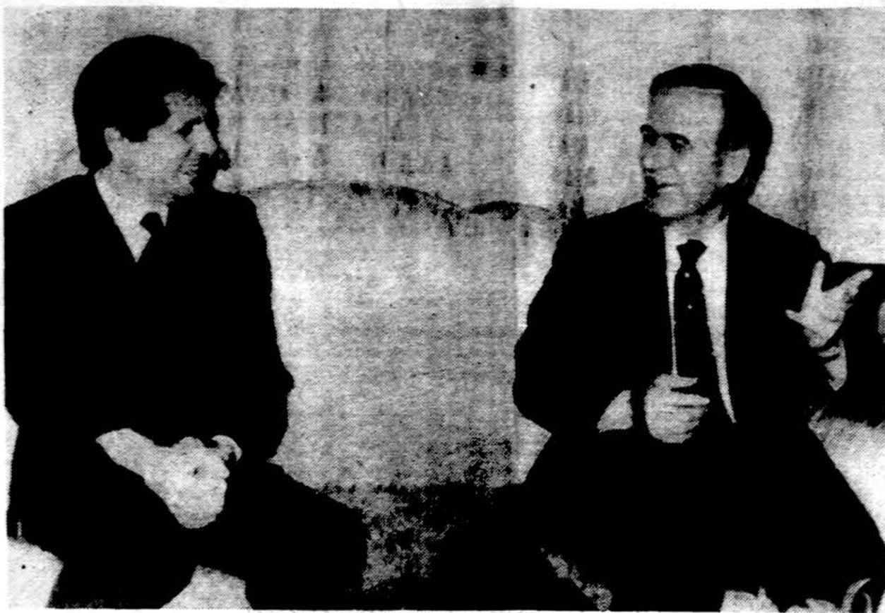
Libano prezidentas Amin Gemayel (kairėje) ir Sirijos prezidentas Hafez al Assad šiemet jau keliskart buvo susitikę dėl taikos Libane

Šiandien pasaulyje yra maždaug 10 milijonų pabėgėlių. Daugumas jų paliko savo gimtuosius kraštus dėl