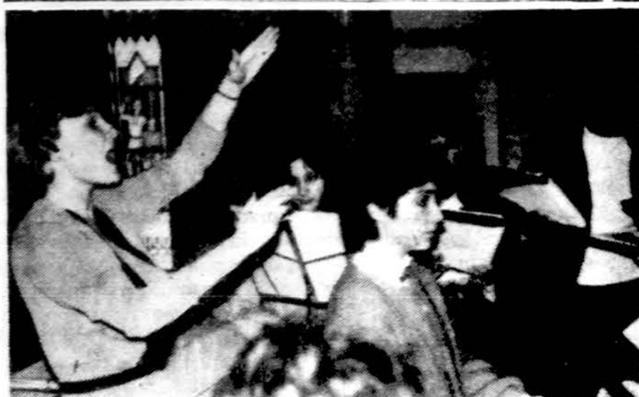
Clevelando Dievo Motinos lietuvių parapijos chorui diriguoja R. Čyvaitė-Kliorienė, akompanuoja K. Kuprevičiūtė.