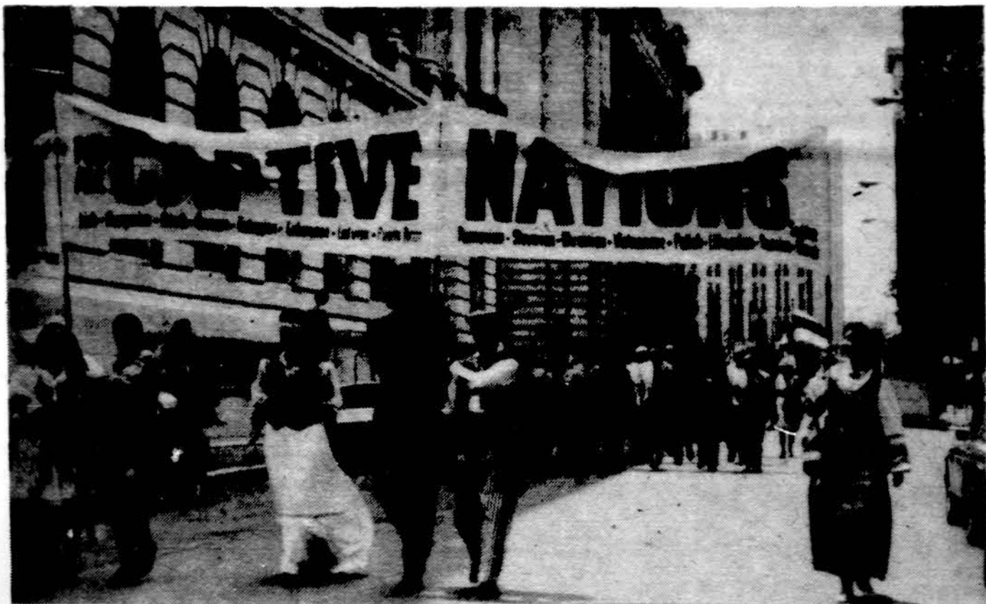
Clevelando lietuviai Pavergtųjų tautų minėjimo eisenoje.