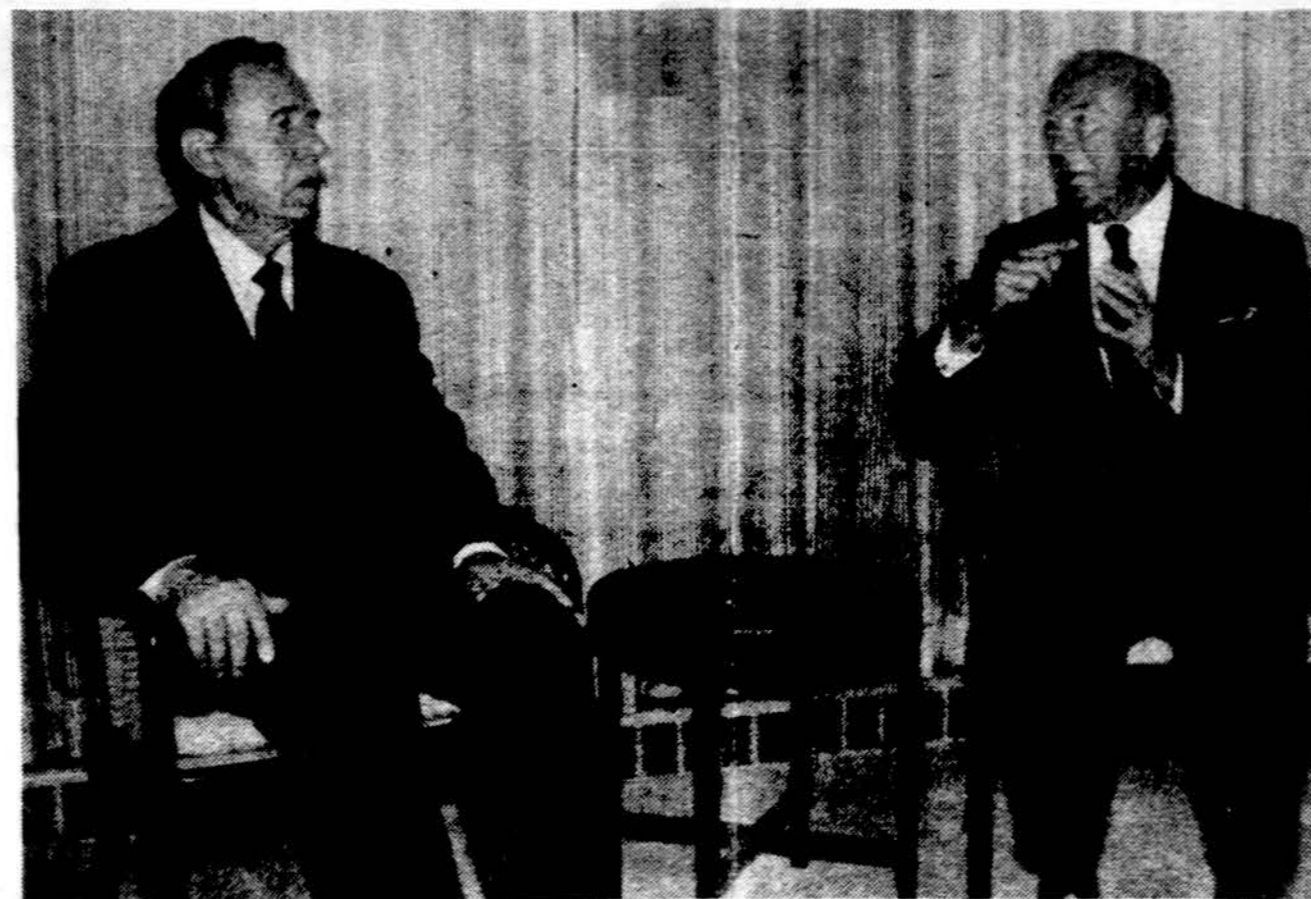
Valstybės sekretorius George Shultz Jungtinėse Tautose tris valandas kalbėjosi su Sovietų Sąjungos užsienio reikalų ministru Andrejumu Gromyko. Susitikimas buvęs naudingas, gera pradžia būsimiems pasitarimams.

— Evangelistas Billy Graham New Yorke pareiškė spaudai, kad jis pastebėjo Sovietų Sąjungoje „palaiptę religijos varžymų mažėjimo linkmę“.