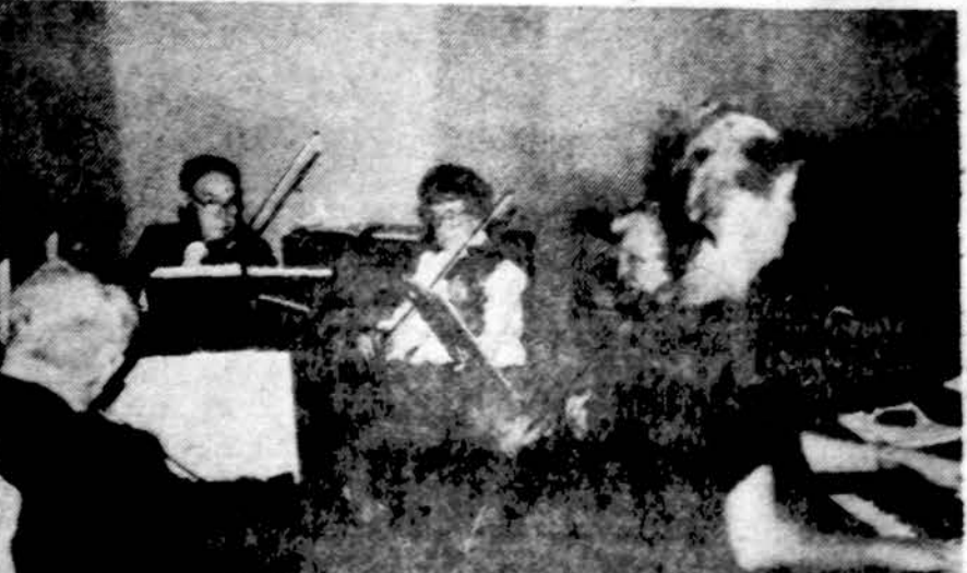
Brighton Parko Nekalto Prasidėjimo parapijos bažnyčioje groja B. Pakšto orkestras Tautos šventės minėjime — rugsėjo 9 d.

Vilniaus krašto lietuvių sąjungos Chicago skyriaus valdyba nuosirdžiai kviečia vitikus lietuvius dalyvauti