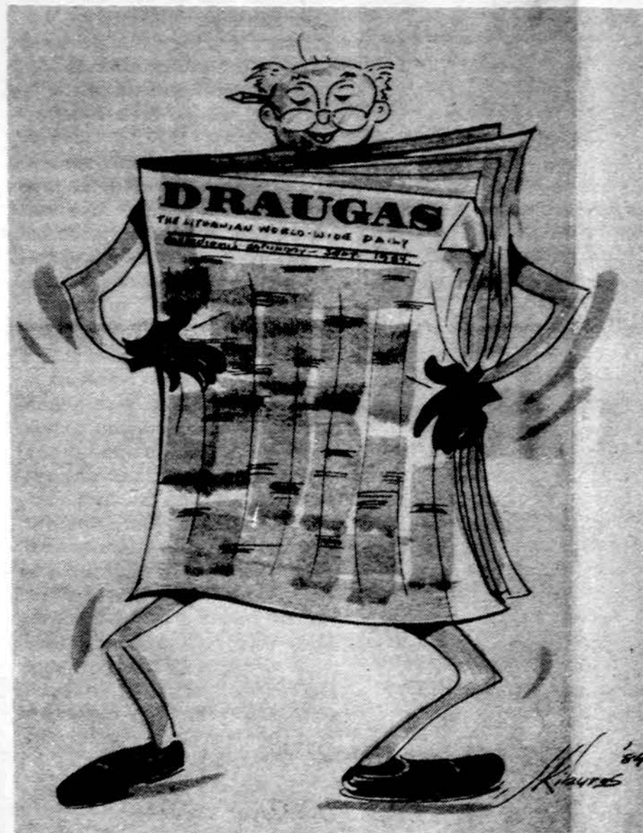
Sekmadienį Chicagoje įvyko Draugo 75 metų sukakties minėjimas. Mūsų karikatūrininkas šia proga skelbia:

Draugai mano mylimieji, Sventiū savo jubiliejū. Nors pražilęs ir senyvas, Bet idėjomis dar gyvas.