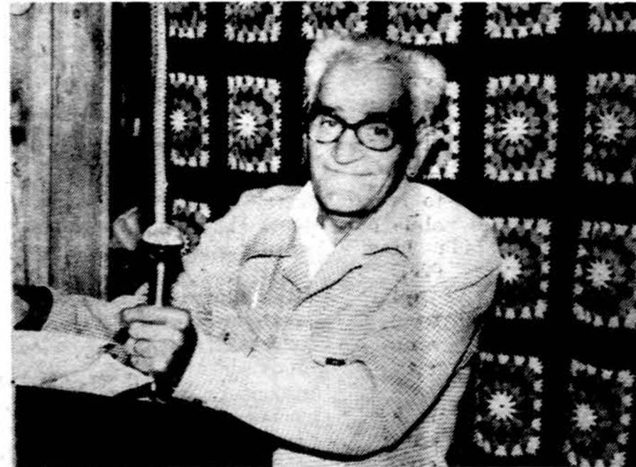
Poetas Juozas Palutis deklamuoja savo kūrybą Sodybos pažmonyje.