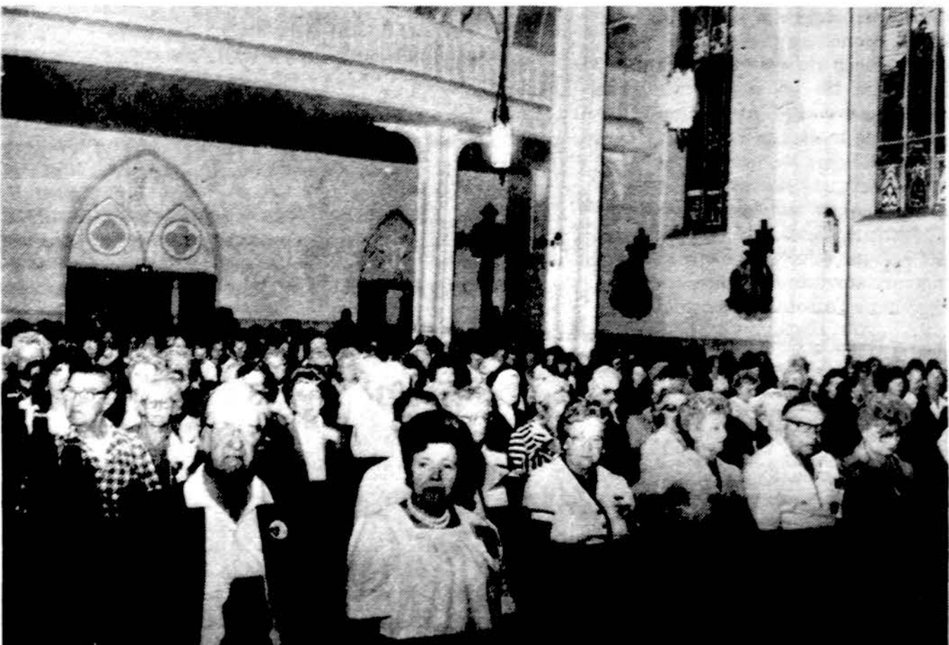
Vyčių 71-mo seimo dalyviai šv. Mišiose Šv. Jurgio bažnyčioje.