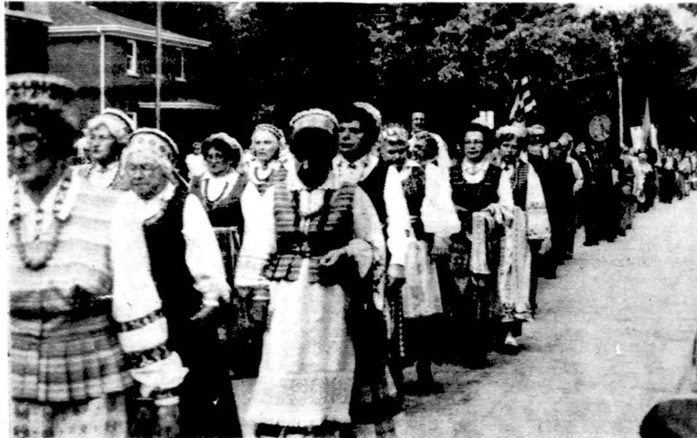
Šv. M. Marijos Gimimo parapijos Šiluvos procesija Marquette Parke.