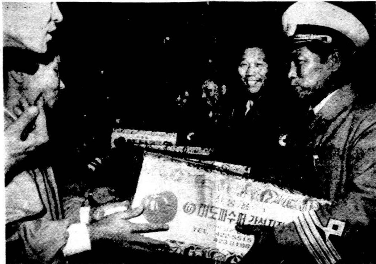
Retos korėjiečių šypsenos. Šiaurinės Korėjos jūreiviai priima dovanas iš Pietinės Korėjos Raudonojo Kryžiaus atstovų. Šiauriečiai atvežė peramą nuo potvynių nukentėjusiems Pietų Korėjos gyventojams.

— Ispanijos premjeras Gonzalez pareiškė, jog jo vyriausybė organizuoja gyventojų referendumą, kuris nustatys ar Ispanija pasiliks NATO nare. Vyriausybė paklausys piliečių sprendimo.