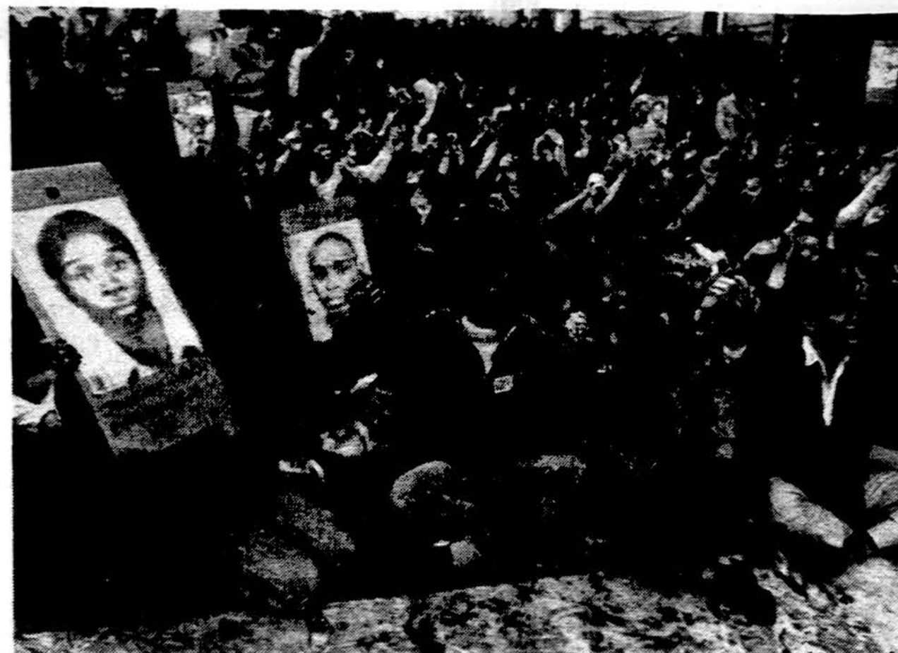
Europoje vis daugiau protestų prieš rasistinę savo Prancūzijos komjaunimo organizacija. Ji reikalauja paleisti iš kalėjimų už savo teises kovojančius afrikiečius.