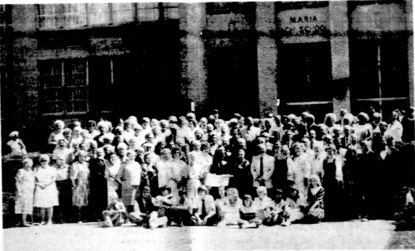
71-mo Vyčių seimo svečiai ir dalyviai prie Marijos mokyklos rūmų Chicagoje.