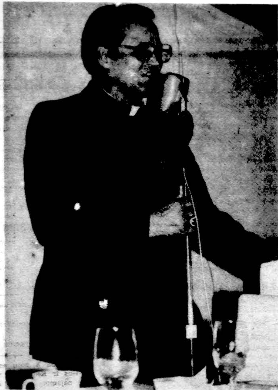
Vyskupas Paulius Antanas Baltakis kalba po jo konsekracijos vykusiam bankete.