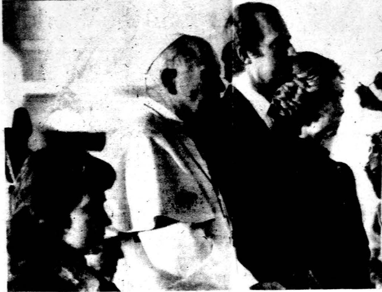
Popiežius Jonas Paulius II lankėsi Ispanijoje, Zaragozos mieste. Nuotraukoje Ispanijos karalius Juan Carlos, karalienė Sofia ir (kairėje) princesė Elena. Popiežius išvyko į Dominikonų respubliką, kur įvyks Pietų Amerikos vyskupų konferencija.

Dabar partiniai ginčai baigėsi ir Kongreso nariai galės grįžti į savo rajonus ir įsijungti į rinkimų kampaniją.