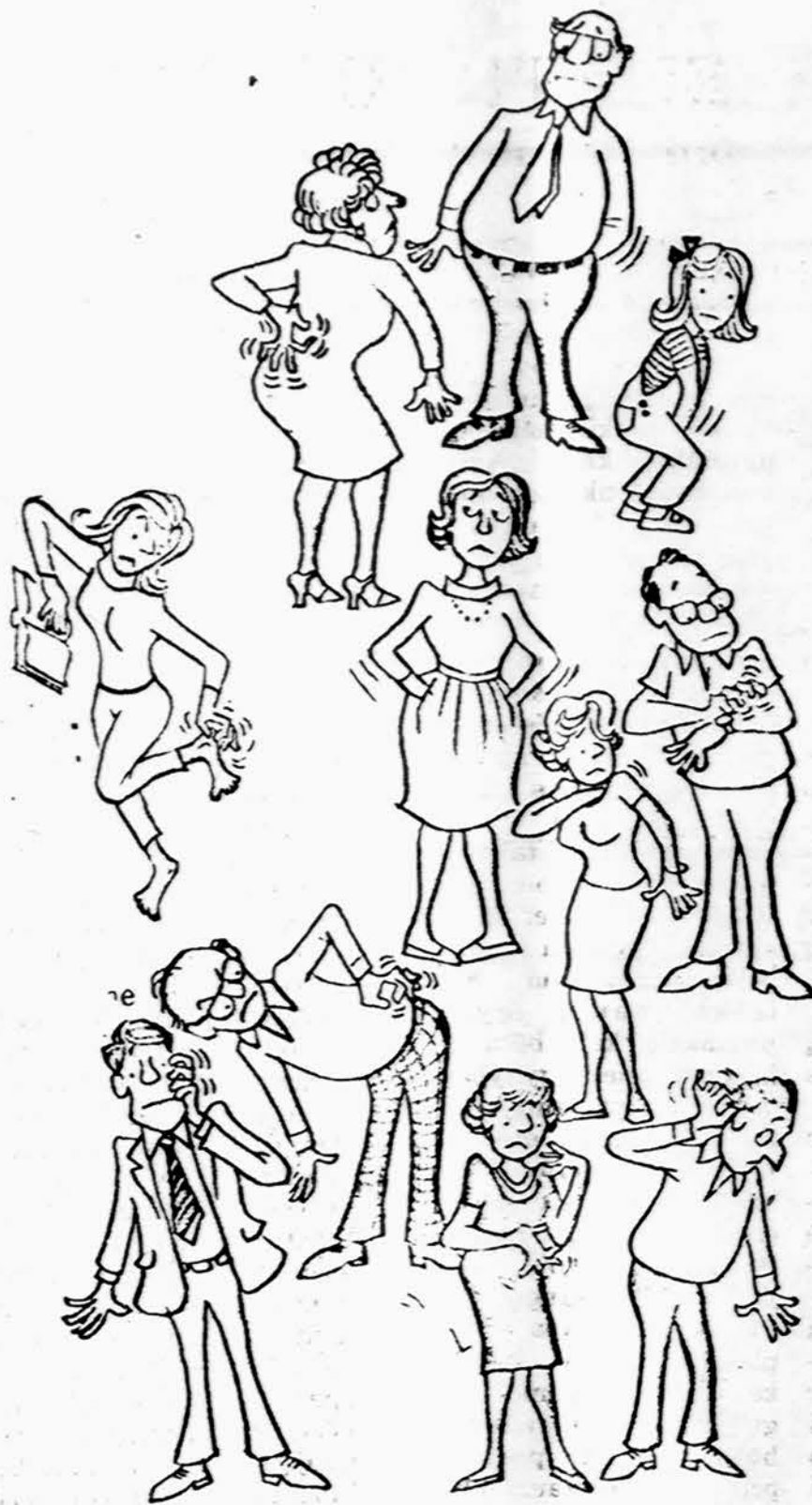
Kad ne tas prakeiktas niežulys, koks būtų malonus gyvenimas mažo, jauno ir pagyvenusio lietuvi!

Ištiriant jo kišenių medžiagą buvo rasta, kad kišenių vidus buvo juodas kaip žemė. Dešinėje kišenėje buvo raktai ant grandinėlos suverti, o kairėje — sidabriniai pinigai. Ištirta buvo jo odos jautrumas nikelio sulfato — ji jam buvo labai jautri.