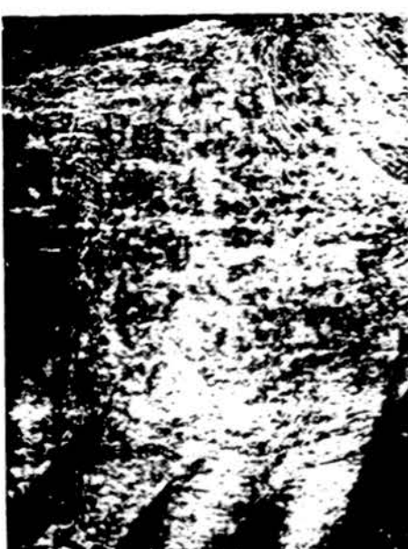
Per 15 metų užsitęsęs ant plaštakos išorinio paviršiaus atsiradęs chroniškas dermatitas dėl nikelio įsijautrinimo pagijo per keletą dienų. Pinguose ir raktų grandinėje esamos nikelinės dalys suteršė kelnų kišenių medžiagą, o jis turėjo paprotį rankas laikyti kelnų kišenėje, būdamas jautrus — alergiškas nikelii