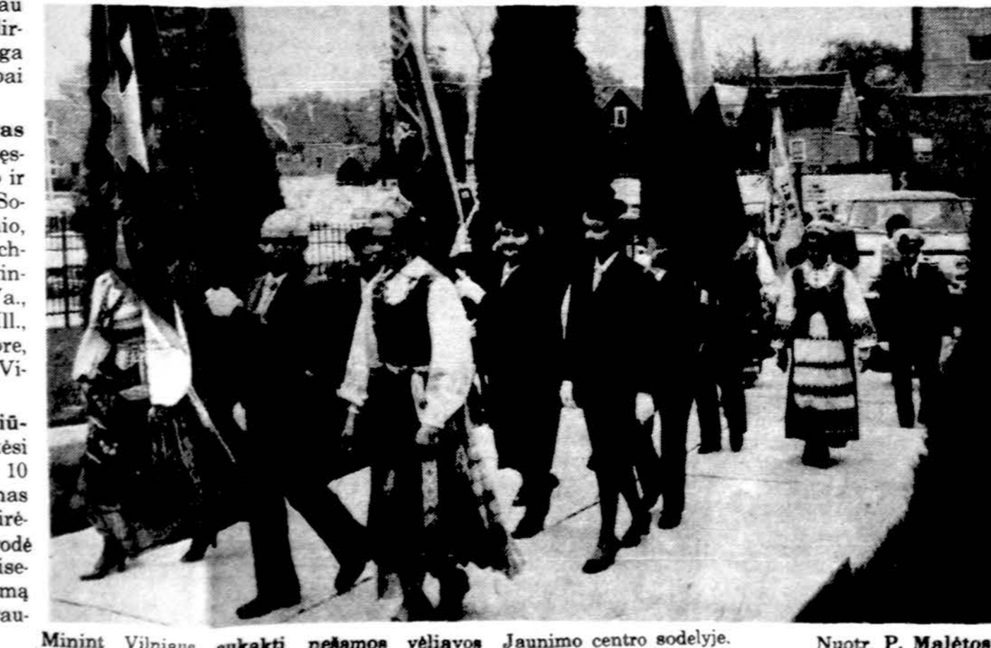
Minint Vilniaus sukaktį nelamos vėliavos Jaunimo centro sodelyje.