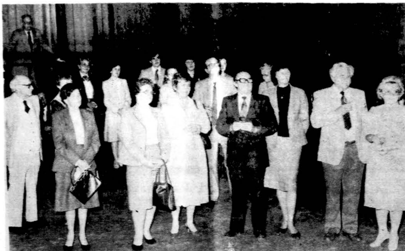
Dalis svečių Illinois universiteto kanclerio trečiajį 100,000 dol. įnašą Lituanistikos katedrai svetainėje spalio 5 d. stebi iškilmes, įteikiant įkurti.