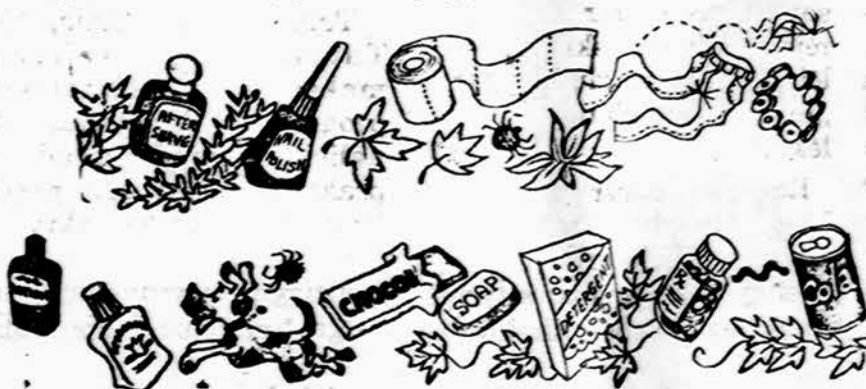
Naudinga ir nereikalinga kosmetika — papuosalai, svaros palaikymo priemonės, plaukuoti ir plunksnuoti žmogaus draugai, augalai, apsirėgimo reikmenys ir parazitai gali sukelti odos niežulį.

Toliau neprisiliečiant niežulio (pruritus) priežastį grupės.