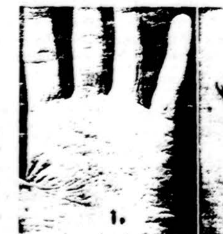
Pvz. 1. Muilo sukeltas niežintis dermatitas. Muilas buvo laikomas kairėje rankoje skalbant baltinius. Labiausiai paliestos delno raukšlės ir tarpupirščiai. 2. Poison ivy sukeltas niežintis dermatitas. Pailga jo forma nurodo, kad su augalo šaka oda buvo paliesta. 3. Vabzdžiui įkandus buvo uždėta antihistamininė medžiaga ir sukėlė jautriam žmogui dermatitą.