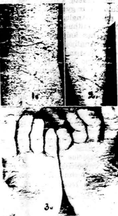
Prislilietimo dermatitas 1. Chroniškas dermatitas prasiđėjęs nuo jautrumui kostiumo medžiagai. Pablogėjęs nuo dažno penicilino medžiagos vartojimo. 2. Prislilietus augalo sukeltas dermatitas. 3. Pakartotinai prislilietiant telefono ragelį gautas niežintis odos išbėrimas.

o apie burną odos žiedas atrodo išblyškęs — griežtai atsiskiria nuo čia pat paraudusios veido odos.