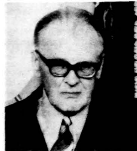
Mūsų mylimas tėvelis, uošvis ir senelis

Žmogus be religijos yra keliautojas — be tikslo, klausiantis — be atsakymo, kovotojas — be pergales, mirštantis — be naujo gyvenimo. S. Augustinas