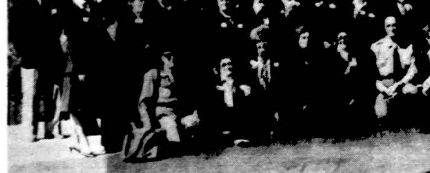
Skautininkų suvažiavimas spalio 7 d. Clevelande.

Visi šeimininkės buvo pakviesti prie vaišių stalo atsiėpročiai, rūkymas, gėrimas, netikėtas maistas sendina. Ypač sendina karštesnis klimatas, tad niekam nepatartina keltis