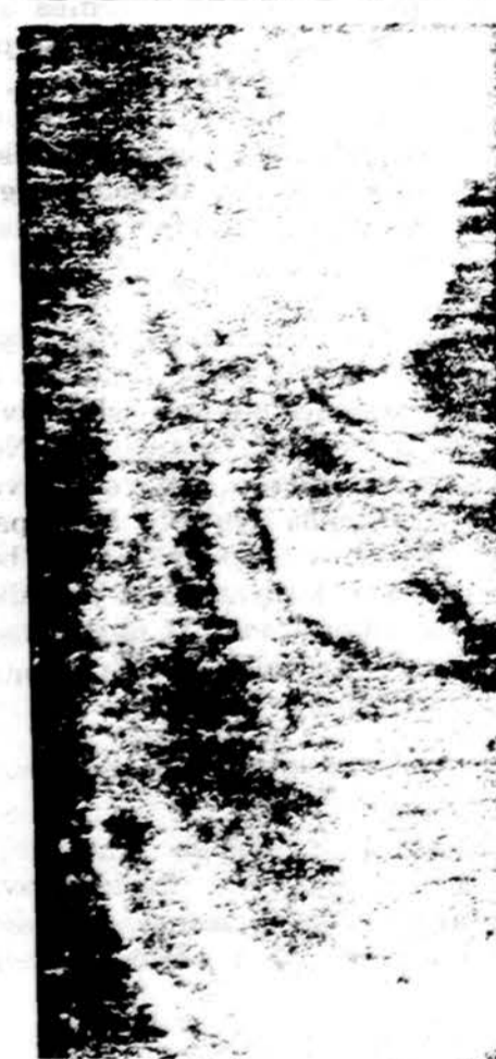
Kailio sukeltas ausyje dermatitas. Paliestos tos vietos, kurios trynėsi į kailinius.

Labai apręžtoje vietoje niežulys nurodo į prislilietimo (contact) dermatitą ar į kuria nors odos ligą bei į parazitinę ar psichinę negerovę.