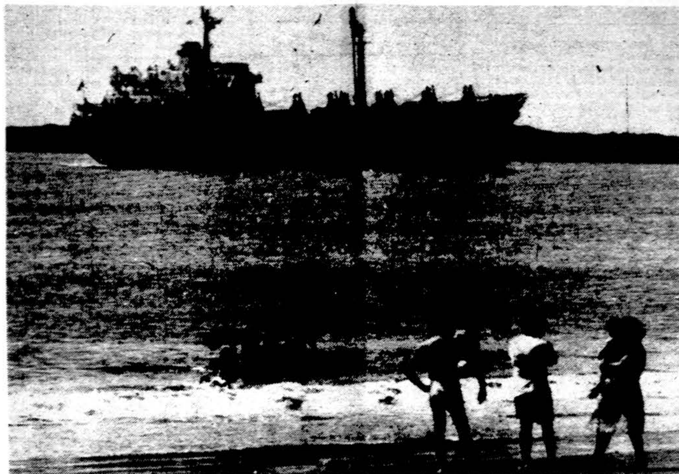
Sovietų prekinis laivas „Bakuriani“, atvežęs laivas atgabeno Nikaragvai modernių Mig lėktuvų, tačiau, valstybės departamento žiniomis, tai nepasitvirtino.

— Zimbabvės premjeras Robert Mugave pašalino iš vyriausybės du ministrus, kurie priklausė opozicijos partijai.