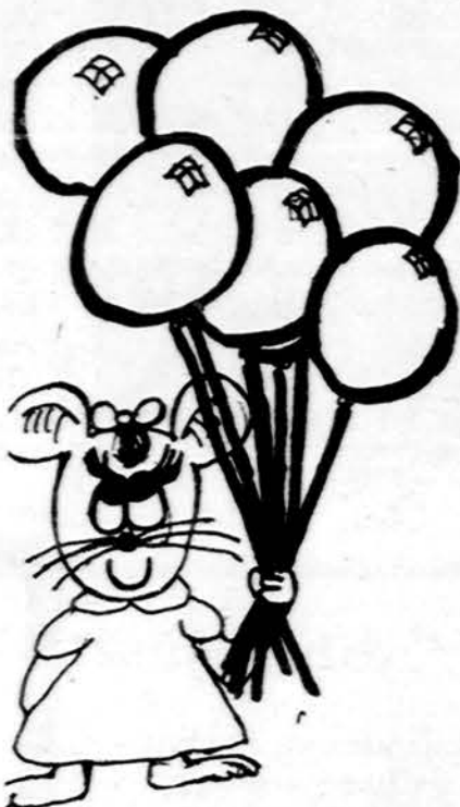
Piešinys iš „Pirmųjų žingsnių“ K. Donelaičio m-los „laikraščelio“

Išleistas Lietuvių Mokytojų Sąjungos Chicago skyriaus