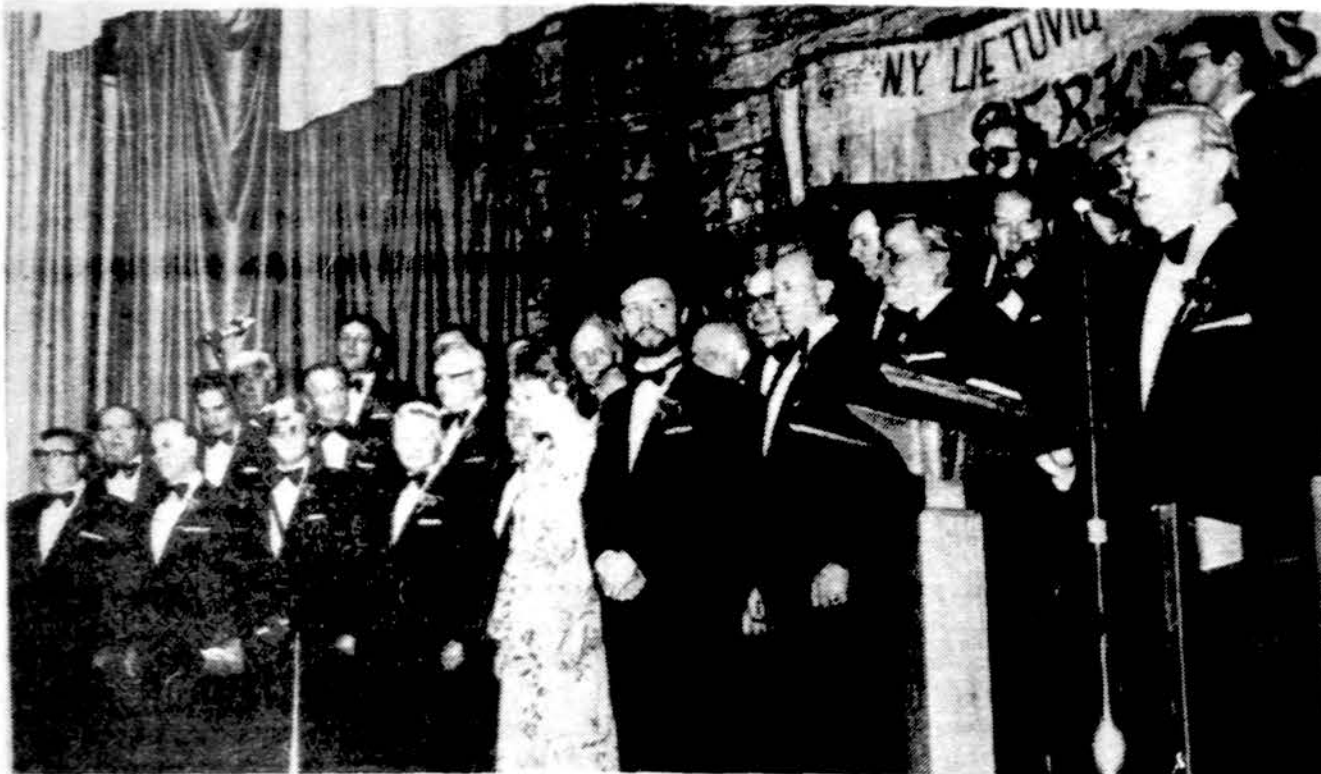
New Yorko lietuvių vyrų choras „Perkūnas“ atliks programą Lietuvos Kariuomenės šventės minėjime Bostone.

Gruodžio 31 d. Naujųjų Metų sutikimas, kurį rengia So. Bostono Pil. d-jos valdyba. Pradžią 9 val. vakaro. Šilta vakarienė. Gros šokiams geras orkestras. Stalus galima