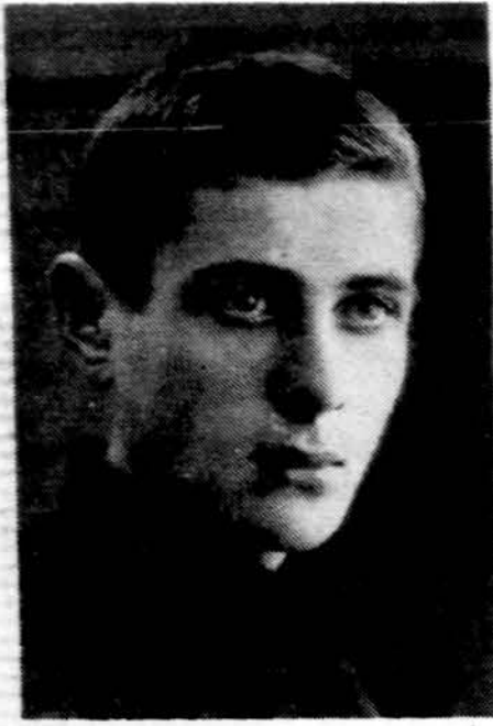
Poetas Vytautas Mačernis