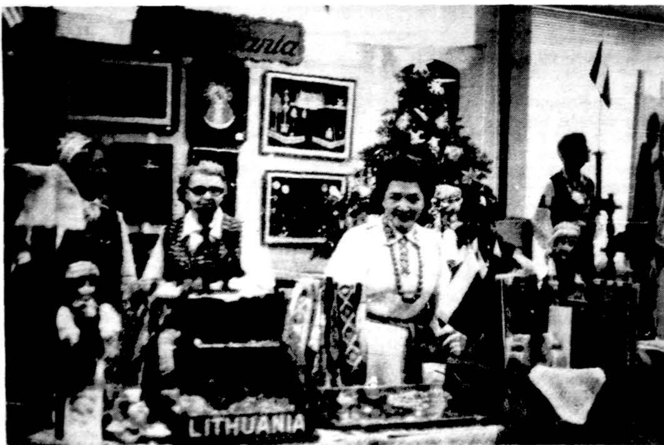
Lapkričio mėn. 17-21 Detroito Tarptautiniame Institute vyko tautybių pasirodymas su savo meno kūriniais. Čia buvo ir lietuvių liaudies meno kūrėjų. Nuotraukoje St. Butkaus šaulių