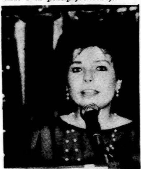
Judy Baar Topinka, lietuvių draugė, išrinkta Illinois senato nare. Ji dėkinga lietuviams, kad jos rinkimų kampanijoje dirbo ir už ją balsavo.