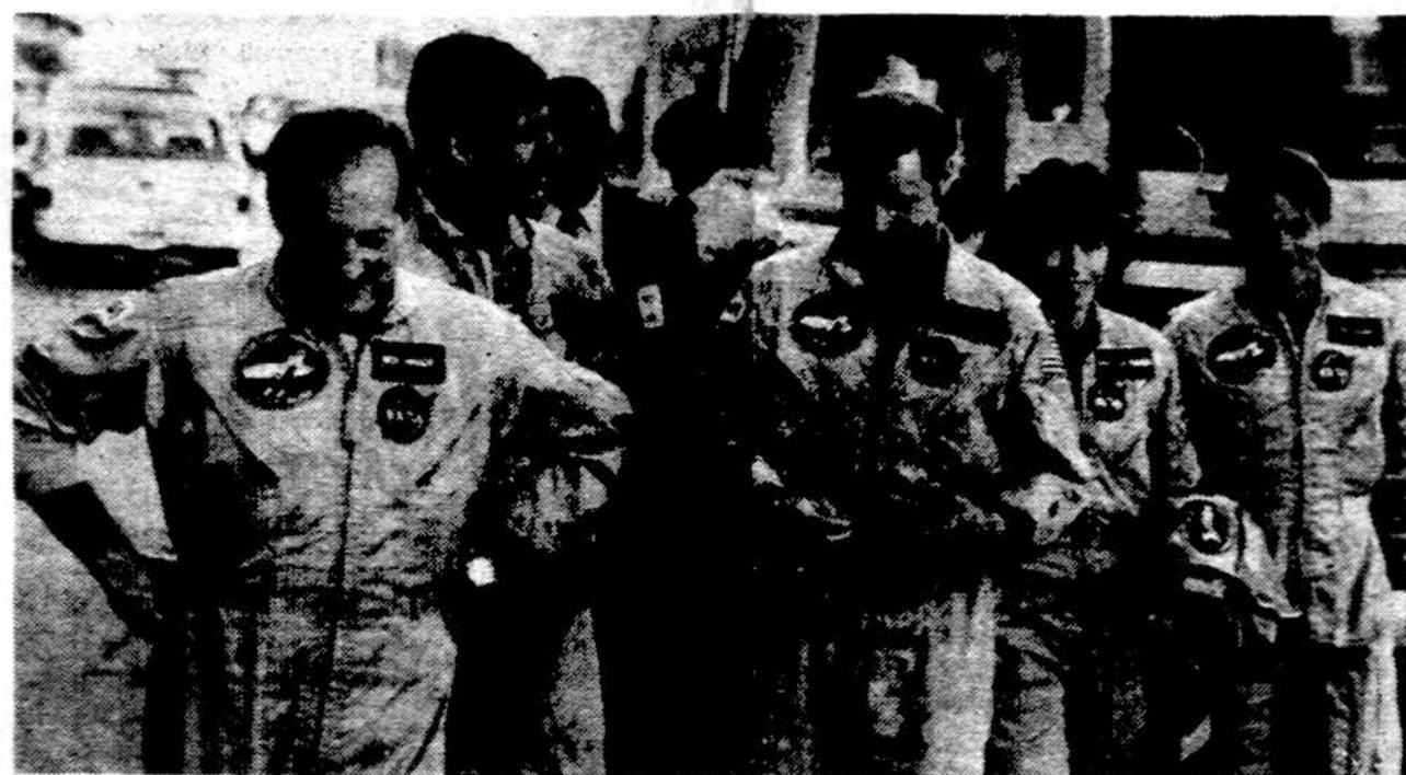
„Discovery“ erdvėlaivio igula: igulos vadas Frederick Hauck, Dale Gardner, David Walker, dr. Anna Fisher ir dr. Joseph Allen.

— Europos Erdvės agentūra paleido į orbitą „Ariane-3“ raketą su dviem satelitais. Vieną užsāk GTE Corp. Amerikoje.