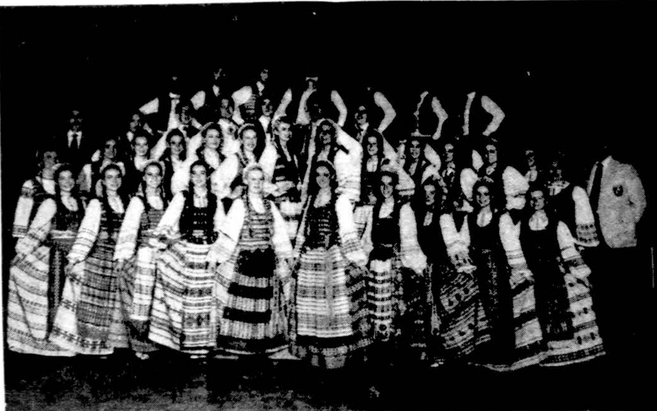
Toronto „Gintaro“ ansamblio vyriausioji grupė šeštadienį, 7 val. vak. Jaunimo centro didžiojoje salėje. Ansamblis koncertuos Chicagoje lapkričio 24 d.

x Nuperkame automobilius ir kitus daiktus gyvenantiems Lietuvoje ir padeda sutvarkyti palikimus. Kreiptis į American Travel Service Bureau, 9727 S. Western Ave., Chicago, Ill. 60643. Tel. 312-238-0787. (sk.)