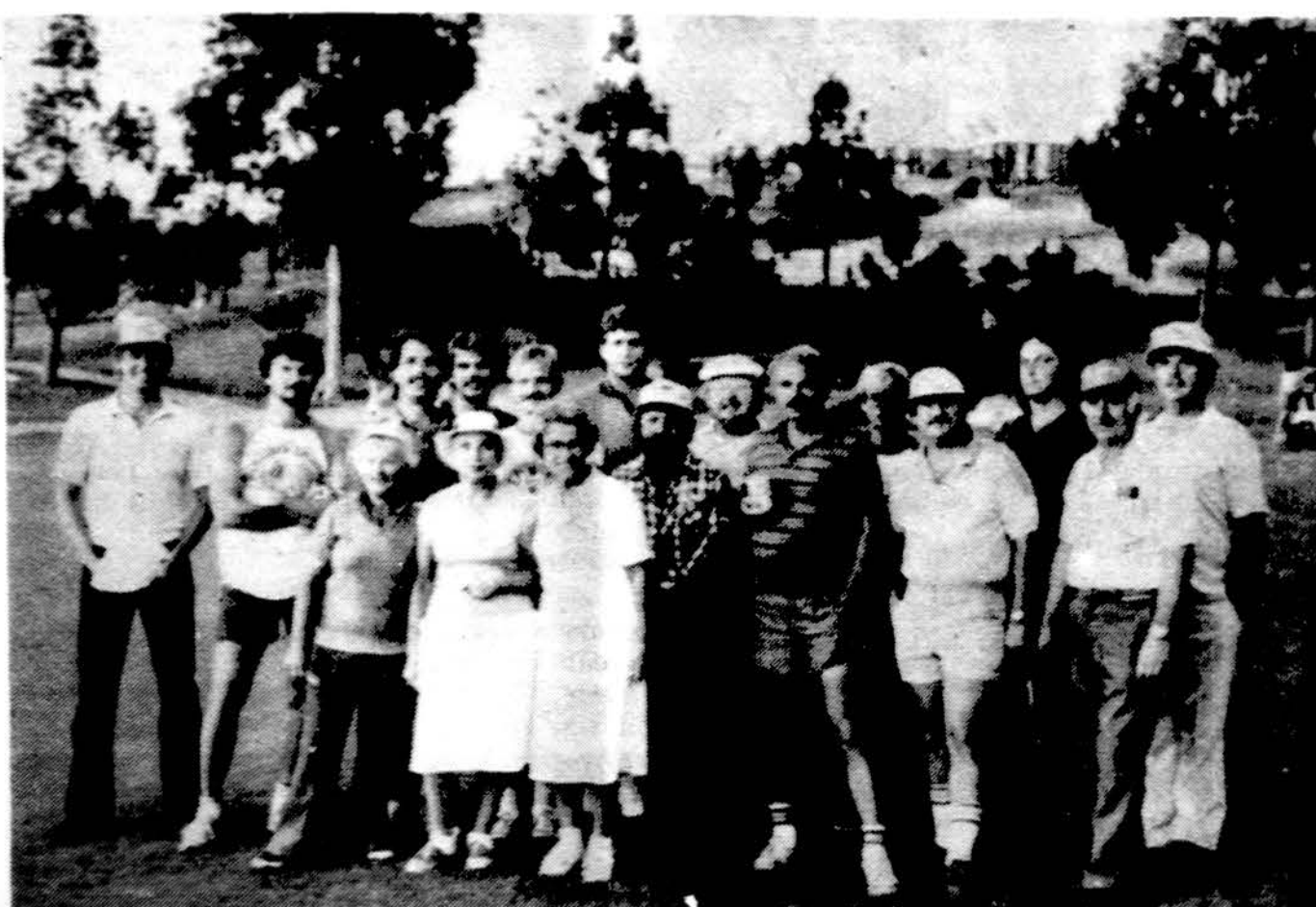
Californijos Lietuvių golfo klubo rudens turnyro dalyviai po žaidinių.