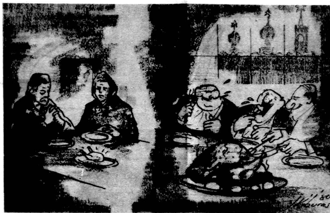
Padėkos diena Sovietijoje. Kairėje — prispausta liaudis, dešinėje — Kremliaus ponai.

Raportė rekomenduojama stiprinti branduolinį arsenalą, atsisakyti ginklų kontrolės sutarčių, kurios neleistų vystyti erdvės gynybos sistelių. Raportas oficialiai bus paskelbtas gruodžio 7 d.