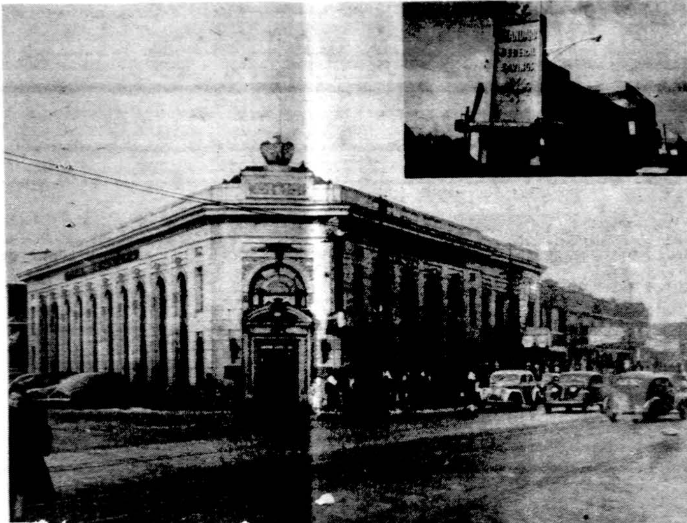
Standard Federal Savings and Loan bendrovės pastatas — toks jis buvo anksčiau (viršuje) ir dabartinis. Bendrovė turi nepaprastą pasisekimą lietuvių ir kitataučių tarpe dėl sąžiningo patarnavimo.

Kartu su tekėjimu iš ausų, atsiradęs apie ausų grybelius niežėjimas gali gautis dėl uždegiminės egzemos (infectious eczematoid dermatitis).