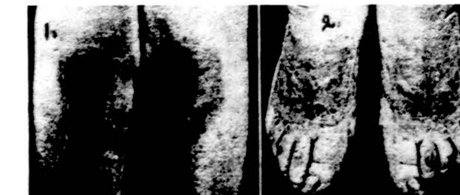
1. Jautriai odai prisilietus tualetto sėdynės (varnišias, plastika, dezinfekcija naudojamas skystis) gaunasi išbėrimas (niežtinčios Contact dermatitis). 2. Avalynės odai jautri pėdų odoje esti