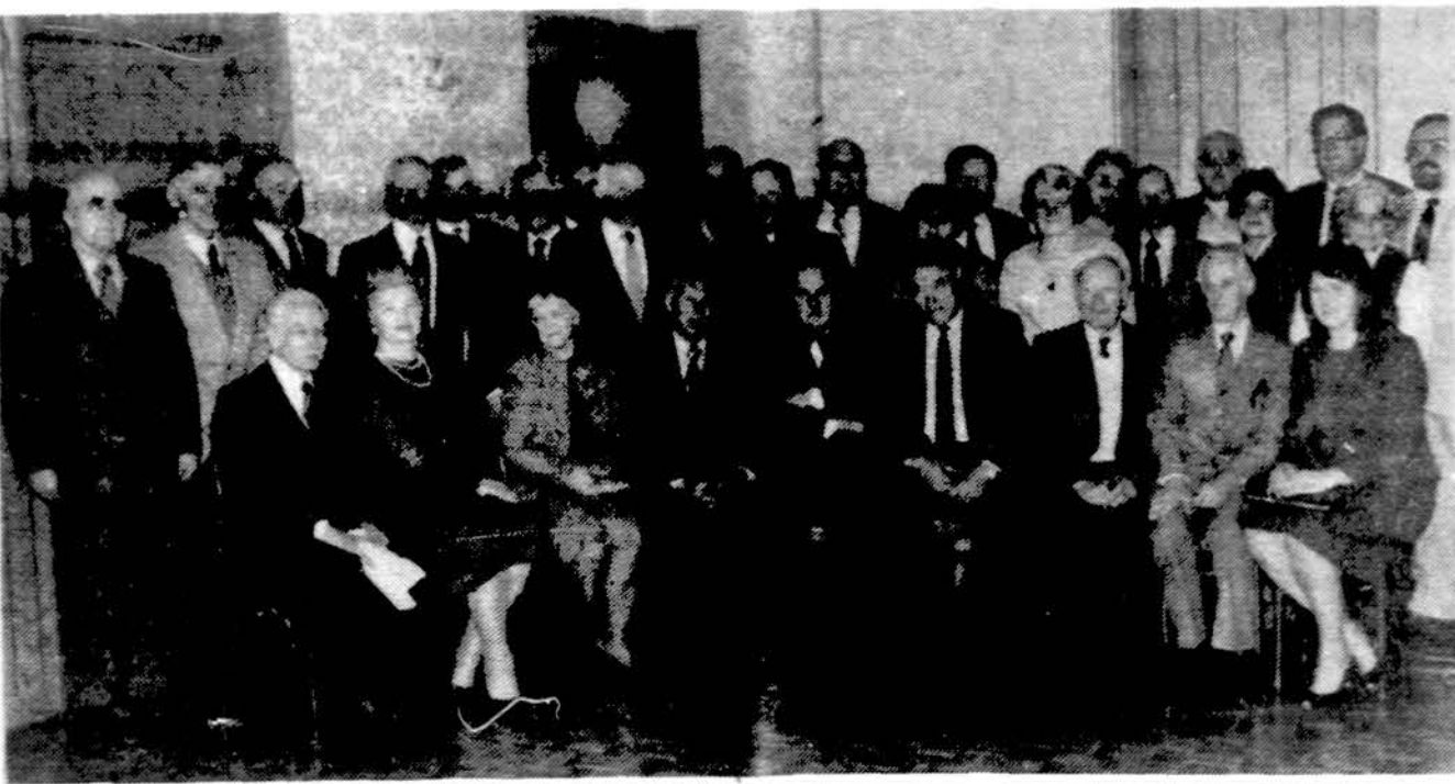
JAV LB Bostono apygardos suvažiavimo dalyviai. Suvažiavimas įvyko lapkričio 17 d. Worcester, Mass. Nuotr. J. Urbono

Balandžio 21 d. Laisvės Varpo pavasarinis renginys.