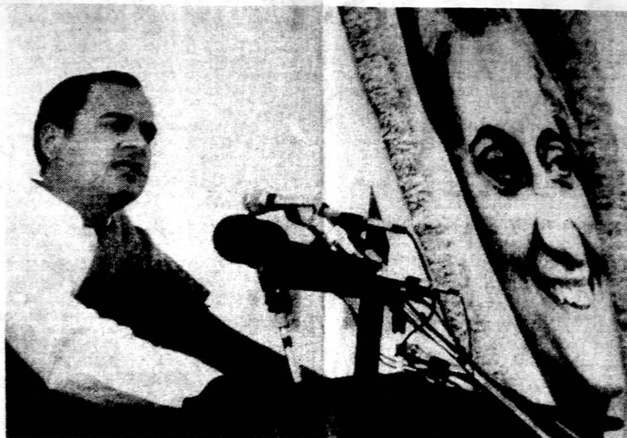
Indijos premjeras Rajiv Gandhi rinkimų kampanijoj šalia savo motinos, nužudytos premjerės Indros Gandhi, portreto. Premjeras išvalė savo kongreso partijos kandidatų sąrašą, išmes-

— Japonija įteikė Sovietų Sąjungai protestą dėl sovietų bombonešių pakartotinai vykdymų japonų oro erdvės pažeidimų ir pareikalavo juos sustabdyti.