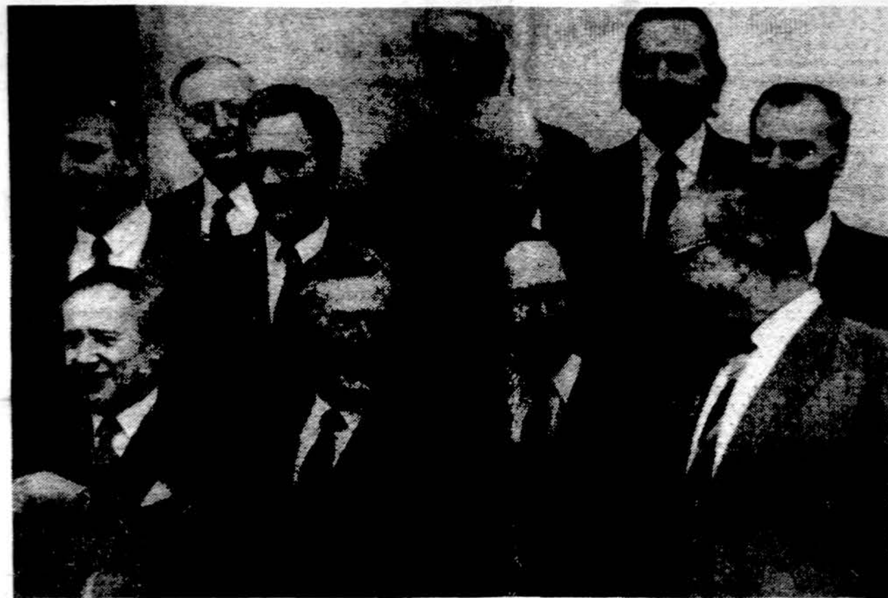
Airijoje įvyko Europos Bendrosios Rinkos vadų pasitarimas. Pirmoje eilėje iš kairės: Europos Rinkos vykdomosios komisijos pirmininkas Gaston Thorn, Danijos premjeras Poul Schlüter, Belgijos premjeras Wilfried Martens ir Vakarų Vokietijos kancleris Helmut Kohl.

Bostono miesto meras Raymond Flynn dovanavo miesto raktą Nobelio Taikos premijos laureatui Pietų Afrikos anglikonų vyskupui Desmond Tutu. Miesto taryba nutarė nebiziūti su įmonėmis, kurios palaiko prekybą ryšius su Pietų Afrikos respublika.