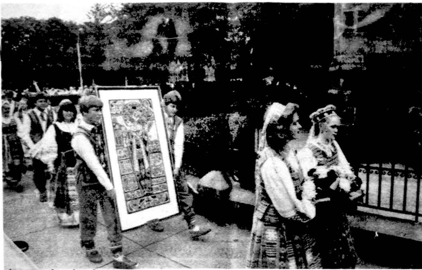
Jaunimo nešamas Bostono arkivyskupiui Bernard Law šv. Kazimiero sukakties minėjime padovanotas šv. Kazimiero grafikos paveikslas.