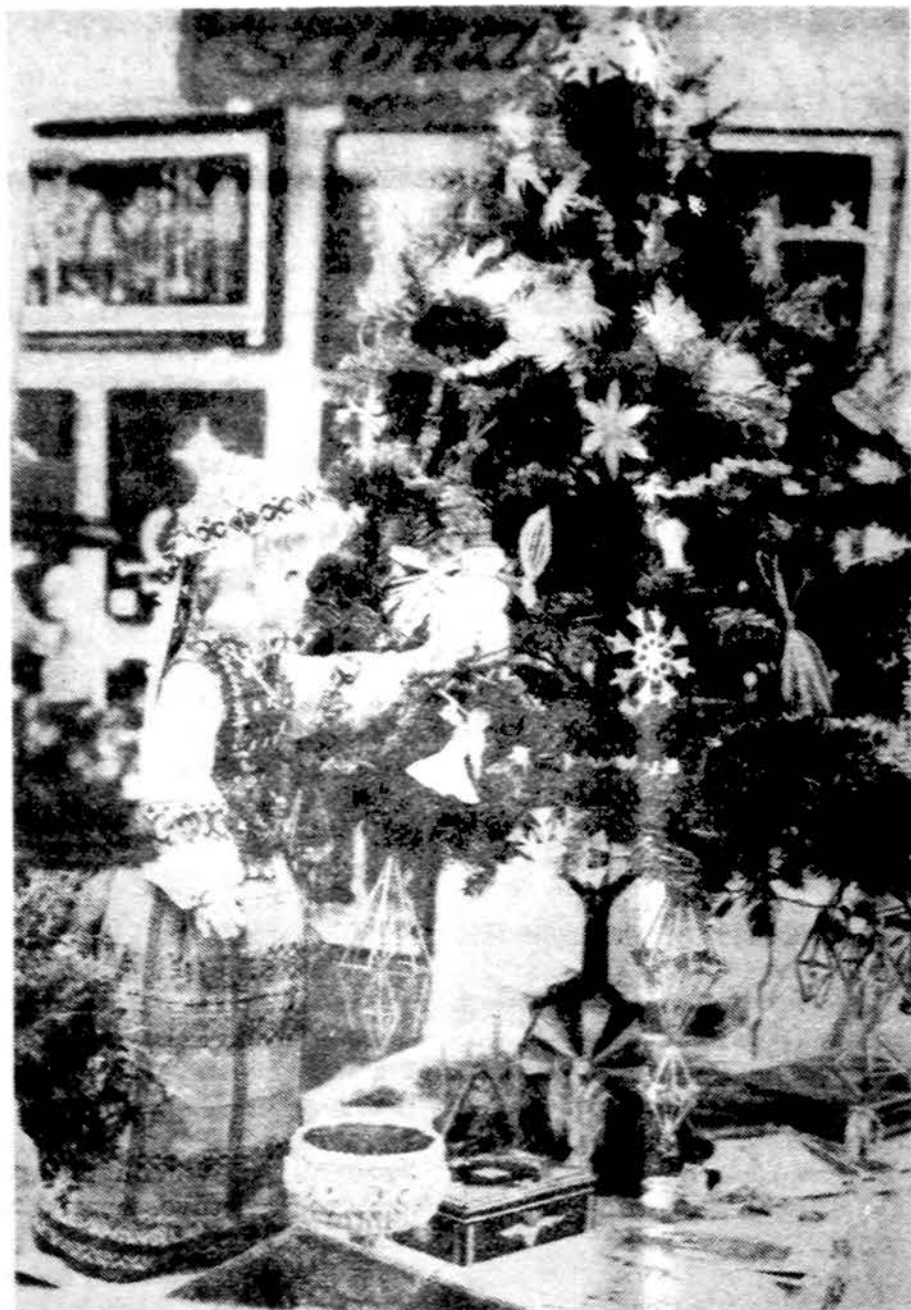
Jonynienės šiaudinukais Detroito papuošta Kalėdų eglutė.

Nors Šv. Kazimiero bažnyčia Pittsburghe yra sena, statyta 1901 metais, ji išsididžiai tebestovi, kaip katedra. Du bokštai skverbiausi į padanges. Skliautinės lubos meniškai dažytos. Nepaprastai graži architek-