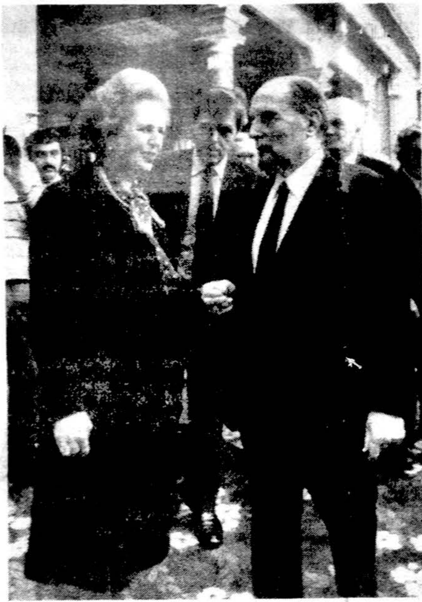
Britanijos premjerė Margaret Thatcher ir Prancūzijos prezidentas Francois Mitterrand susitiko Paryžiuje ir po kelių dienų — Dubline, Europos Rinkos vadų konferencijoje. Abiejų valstybių vadai vėl nagrinėjo tilto ar tunelio statybos klausimus. Pirmą kartą tie klausimai buvo iškelti prieš 182 m. Prancūzija ir Angliją skiria 23 mylių vandens juosta.

Washingtonas. — Naftos milijonierius Armand Hammer, kurio tėvas Julius buvo vienas iš JAV komunistų partijos steigėjų, lankėsi Maskvoje ir 95 minutes tarėsi su Konstantinu Černenka. Hammeris palaiko glaudžius politinius ir prekybos ryšius su komunistinėmis šalimis. Sakoma, kad 1921 m. jis Maskvoje matėsi su Leninu ir buvo jo vertinamas. Černenka pasakė, jog Amerika nebus pirmoji panaudoti atominius ar kitus ginklus, tačiau ji pasilaiko teisę atsilipti atominiais ginklais į bet kurią ataką. Tokia Amerikos politika tęsiasi jau daug metų.