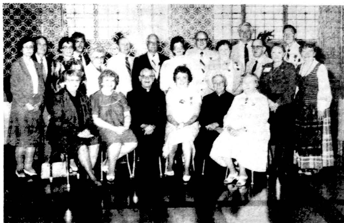
1984-85 veiklos metų Lietuvos vyčių organizacijos centro valdyba, komitetų pirmininkai ir „Vyčio“ redakcijos nariai.

GYDYTOJAS IR CHIRURGAS 6745 West 63rd Street Val. pirm., antr. ketv. ir penkt. 2-6; šeštadieniais pagal susitarimą