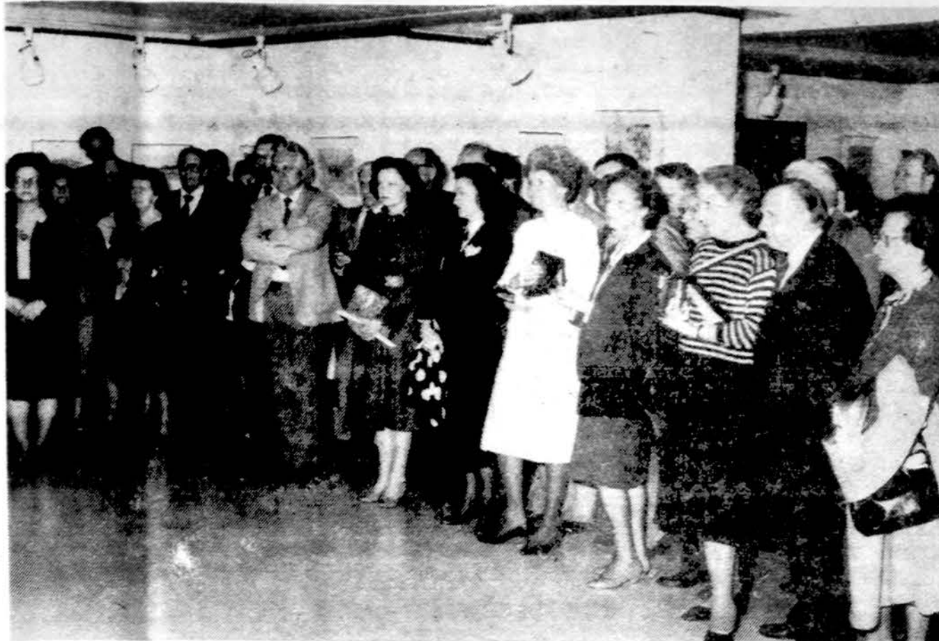
Svečiai dail. M. Dobužinskio „Senosios Lietuvos“ piešinių parodoje, kurią surengė Lietuvių Dailiojo meno institutas lapkričio 23 d.