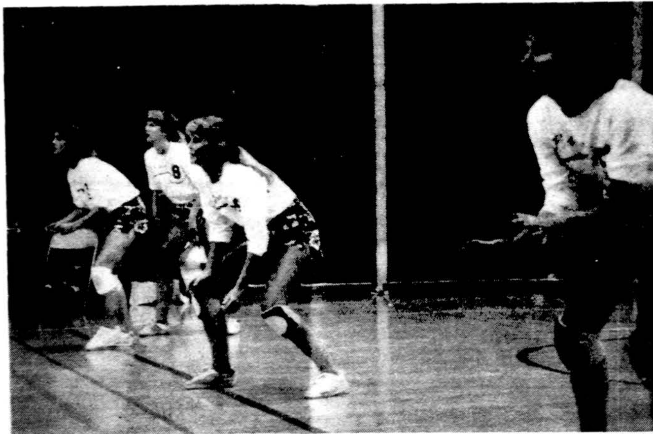
Los Angeles „Banga“ II-siose Pasaulio Lietuvių Sporto žaidynėse Chicagoje.

Chicago Lietuvos Teniso klubas šeštadienį, gruodžio 15 d., 7:30 val. vak. Oakbrook teniso klubo patalpose praves „Round Robin“ varžybas. Po varžybų bus užkandžių ir gėrimų atsisveikinimui. Dalyvavimo kaina 12 dol. užsimokėjusius 1984-85 m. nario mokesčių. Svečiams ir kitiems