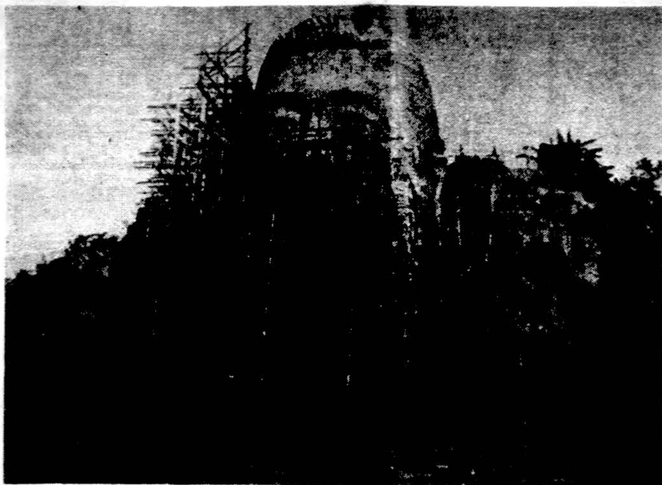
Filipinuose vis plinta gandai, kad prezidentas Ferdinand Marcos sunkiai serga. Jo kritikai baigias prezidentui Bagulo kurortiniame mieste statomas, nuotraukoj matomas, paminklas, 50 metų biustas, pradėtas 1979 m.

Prezidentas įsakė išimti iš vyriausybės javų sandėlių 300 tūkstančių metrinių tonų javų, kurie bus skiriami badaujančioms Afrikos ir Azijos tautoms. Tam tikslui skiriama ir 50 mil. dol. Vyriausybė turi sandėliuose 4 mil. tonų kviečių, kurių dalis bus skirta badaujančioms šelpiti.