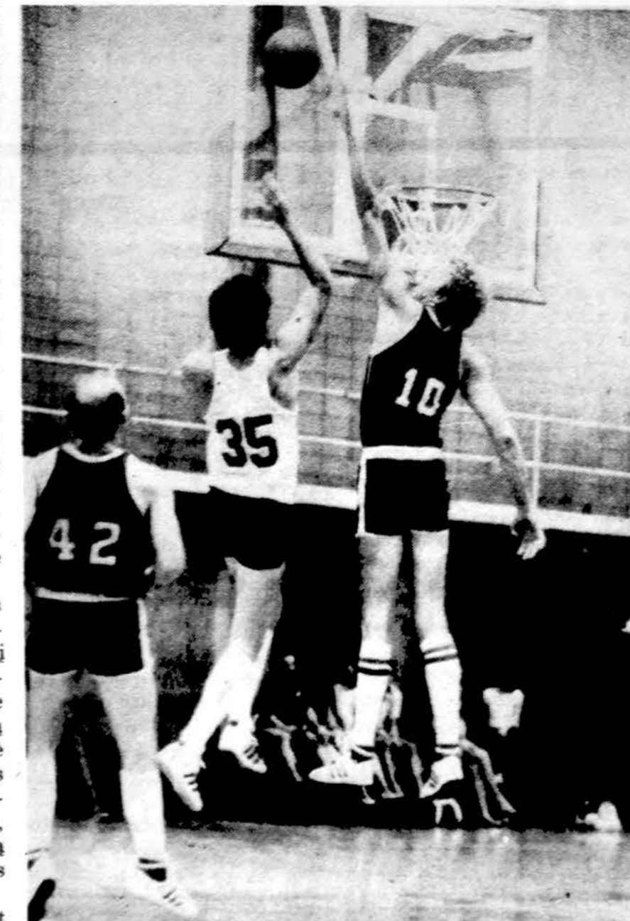
Detroito „Kovas“ ir Toronto „Austra“ II-ųjų Pasaulio Lietuvių Sporto žaidynių finalinėse rungtynėse.