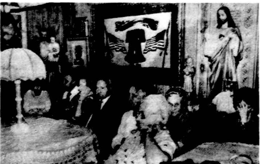
Dalis lietuvių klauso sveikatos patarimų Sodybos pažmonyje.