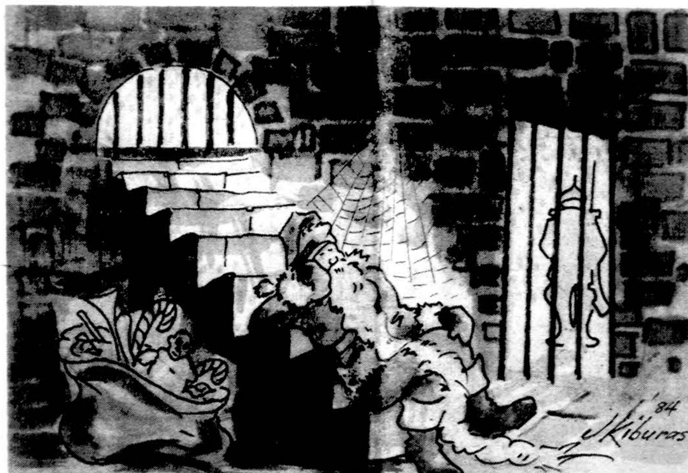
Kalėdų Senelis Vakarų pasaulyje turi daug darbo. Visai kitoks Senelio likimas Sovietų Sąjungoje.

Salos miesteliuose keliai ir gatvės prasti, elektros ir vandens tiekimas blogas, kanalizacijos vamzdžiai nepatikimi. Amerika jau skyrė 25 mil. dol.