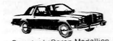
Chrysler LeBaron Medallion 2-dr Coupe

PIRKdami NAUJUS AR VARTOTUS AUTOMOBILIUS SUTAUPYSITE NUO $300 IKI $1,000