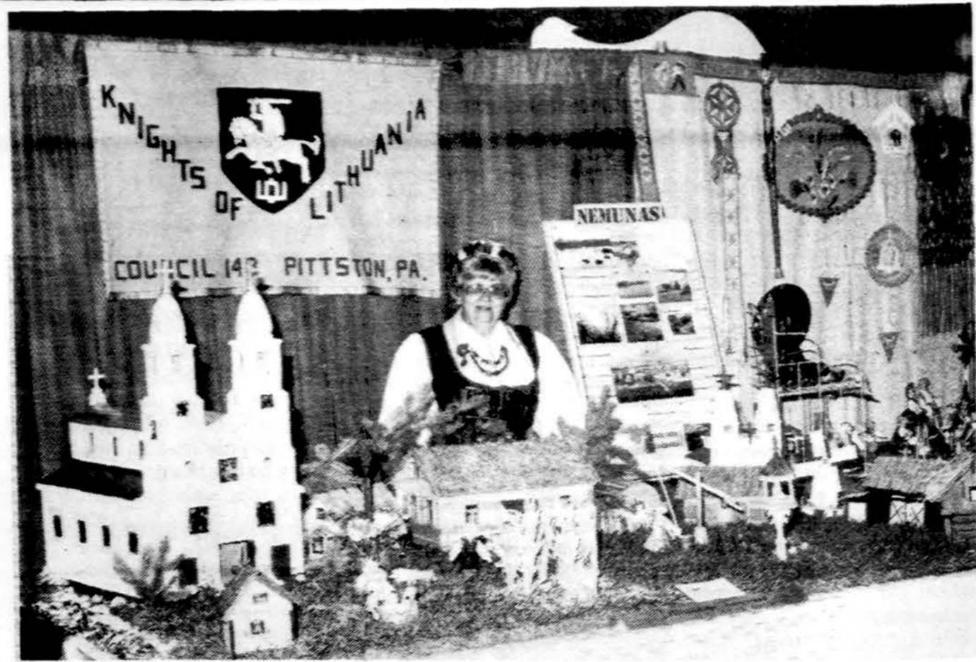
Luzerne apskrities tautų festivalyje Pennsylvanijos Lietuvos Vyčių stalias su tautiniais