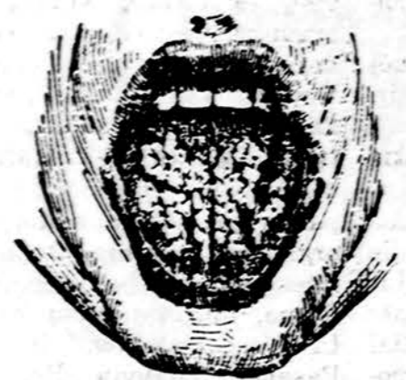
Žmogaus liežuviu paviršiuje balti, sustorėję lopai — Leukoplakia: vėžio pranokėjimas.

Pagrindiniai laboratoriniai kraujo tyrimai gali talkinti