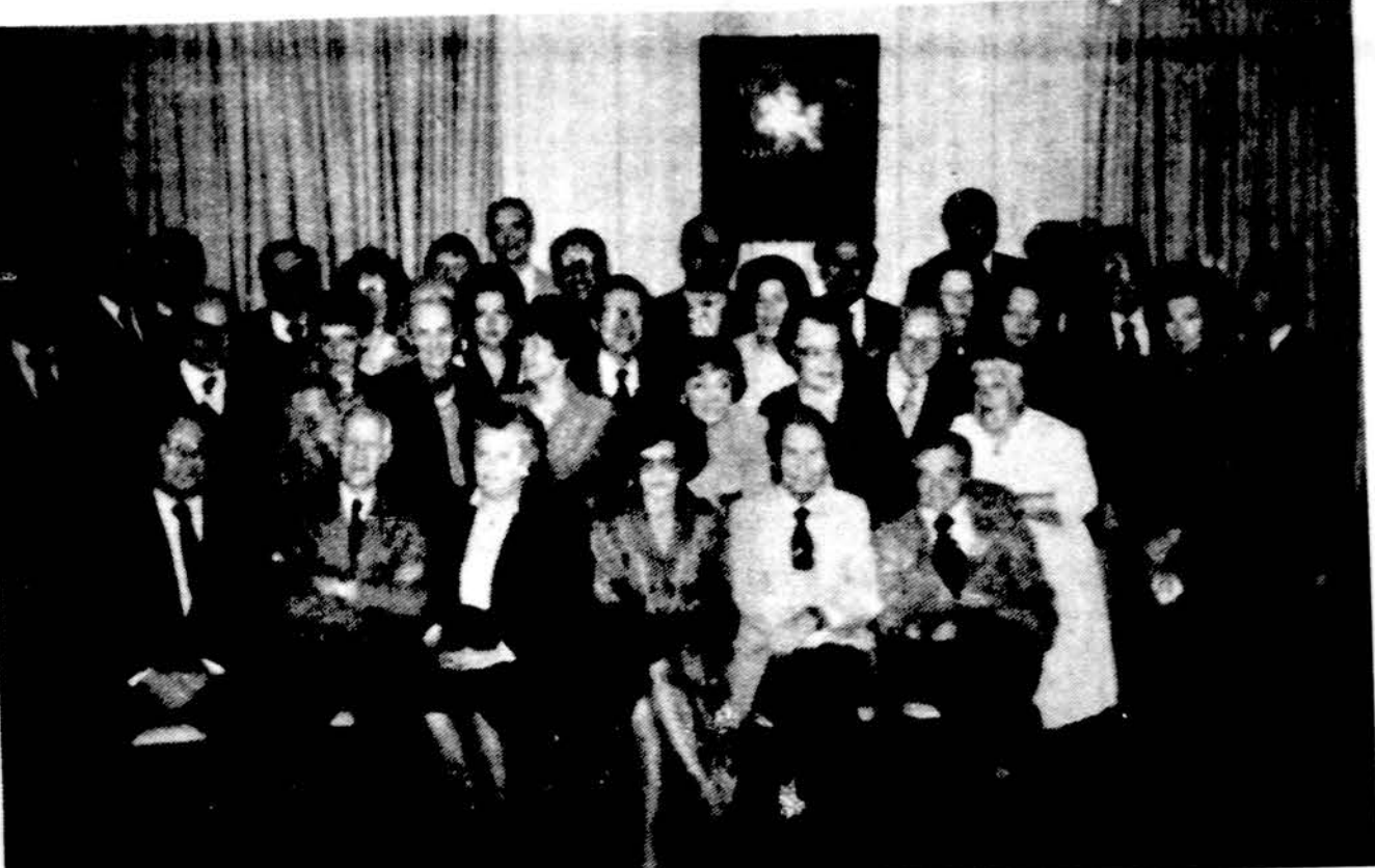
Lietuviai inžinieriai ir architektai su svečiais kalediniame pobūvyje gruodžio 7 d.

Visiems aukotojams Lietuvos Fondo vadovybė nuoširdžiai dėkoja. Nors reikiama suma su kaupu jau surinkta ir nenorj pasiskelbti geradarių įmokėjo 100,000 dol., bet aukos laukiamos ir toliau, siekiant sukaupti tokį kapitalą, kad jo pajamų užtektų visiems lietuviškiems poreikiams patenkinti. Aukos nurašomos nuo federal. mokesčių. Cekius rašyti ir siųsti: Lithuanian Foundation, Inc., 3001 West 59th St., Chicago, IL 60629, telef. 312-471-3900. (pr.)