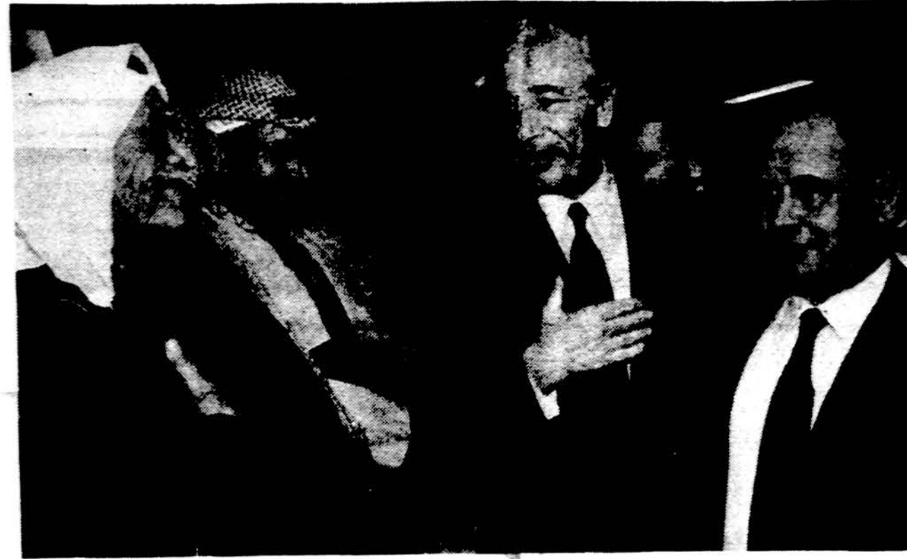
Izraelio premjeras S. Peres (antras iš dešinės) Kalėdų proga aplankė Betliejaus miestą, kur buvo suvažiavę daug turistų iš Vakarų pasaulio.

— Vietnamo okupuotoje Kambodijoje vyksta mūšiai jau 10 dienų. Aršios kovos vyksta dėl vandens šaltinių buvusioje partizanų stovykloje.