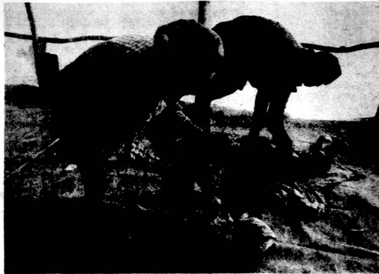
Etiopijos pabėgėlių Korem stovykloje vidutiniškai kasdien miršta po 50 žmonių. Dviejų vaikų kūnai parengiami laidotuvioms. Nors tarptautinės šalpos organizacijos ir Vakarų vyriausybės