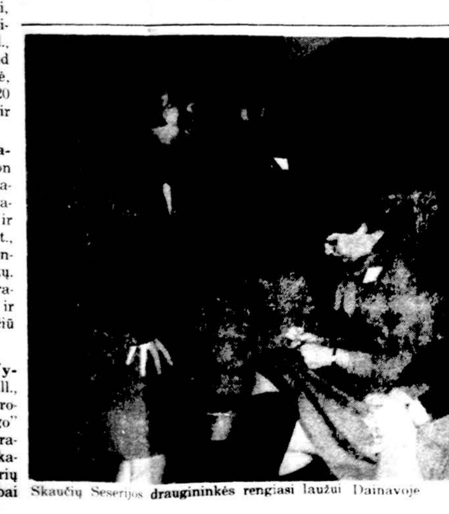
Skaucų Seserijos draugininkės rengiasi lauzū. Dainavoje

Kaip ir kiekvienais metais, taip ir šįmet gruodžio 15 d., šeštadienio vakaras, buvo skirtas lietuvių eglutės programai. Tam buvo paskir-