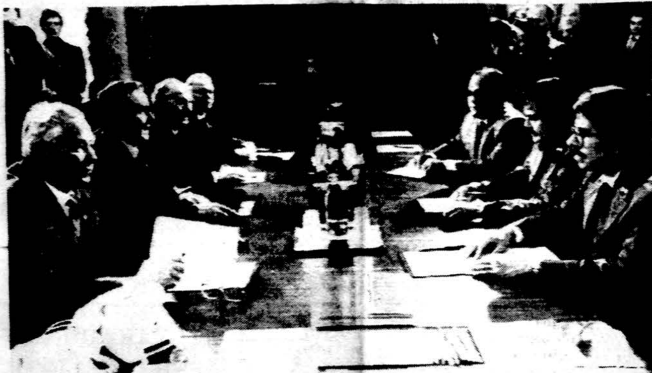
Nikaragvos sandinistų direktoriato vadas Daniel Ortega (dešinėje) neseniai lankėsi Maskvoje ir tarėsi su sovietų vadais: Konstantinu Černenką (kairėje) užsienio reikalų ministru Andrejom Gromyka (antras iš kairės). Ortega tapo Nikaragvos prezidentu. Vakarų spauda rašo, kad jis esąs nuosaukis, pragmatiškas, tačiau turįs derinti

bių, — pabrėžė Šv. Tėvas, — nėra įmanoma sukurti sveiką, teisingą ir brolišką žmonių bendruomenę. Kitoje privačioje audiencijoje popiežius Jonas Paulius II priėmė Europos parlamento pirminką Pierre Pflimlin drauge su jo artimaisiais bendradarbiais.