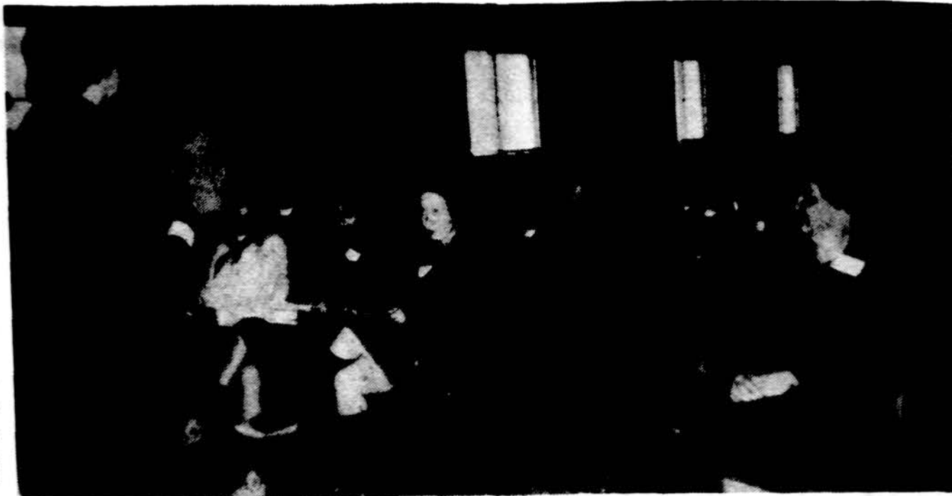
Skaučių seserijos draugininkių kursai Dainavoje.

Pakeliui iš bažnyčios į namus automobilyje atsikuku radiją. Štai nelaukta žinia: Bears laimėjo prieš Redskins rezultatu 23:19. Net ir žmona, kuri sportu mažiausia domisi, sušunka: „Gerai, kad Washingtono ponai Redskinsai pralaimėjo!“ Tuo tarpu mieste nei įprasto triukšmo, nei entuziazmo, koks čia būdavo mato