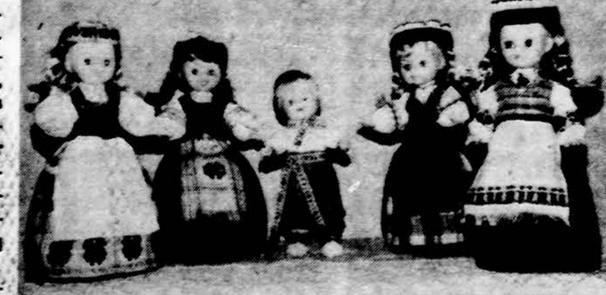
Lietuviškos lėlės, kurias matė šimtai denveriškių.