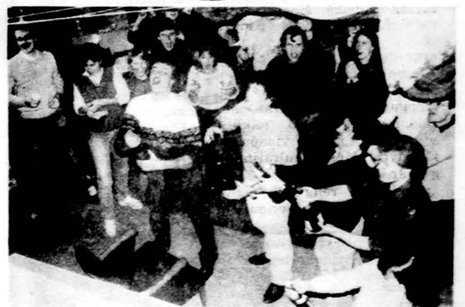
Neringos slidinėjimo stovykloj pasirošę kamščiais iššauti Naujus Metus!