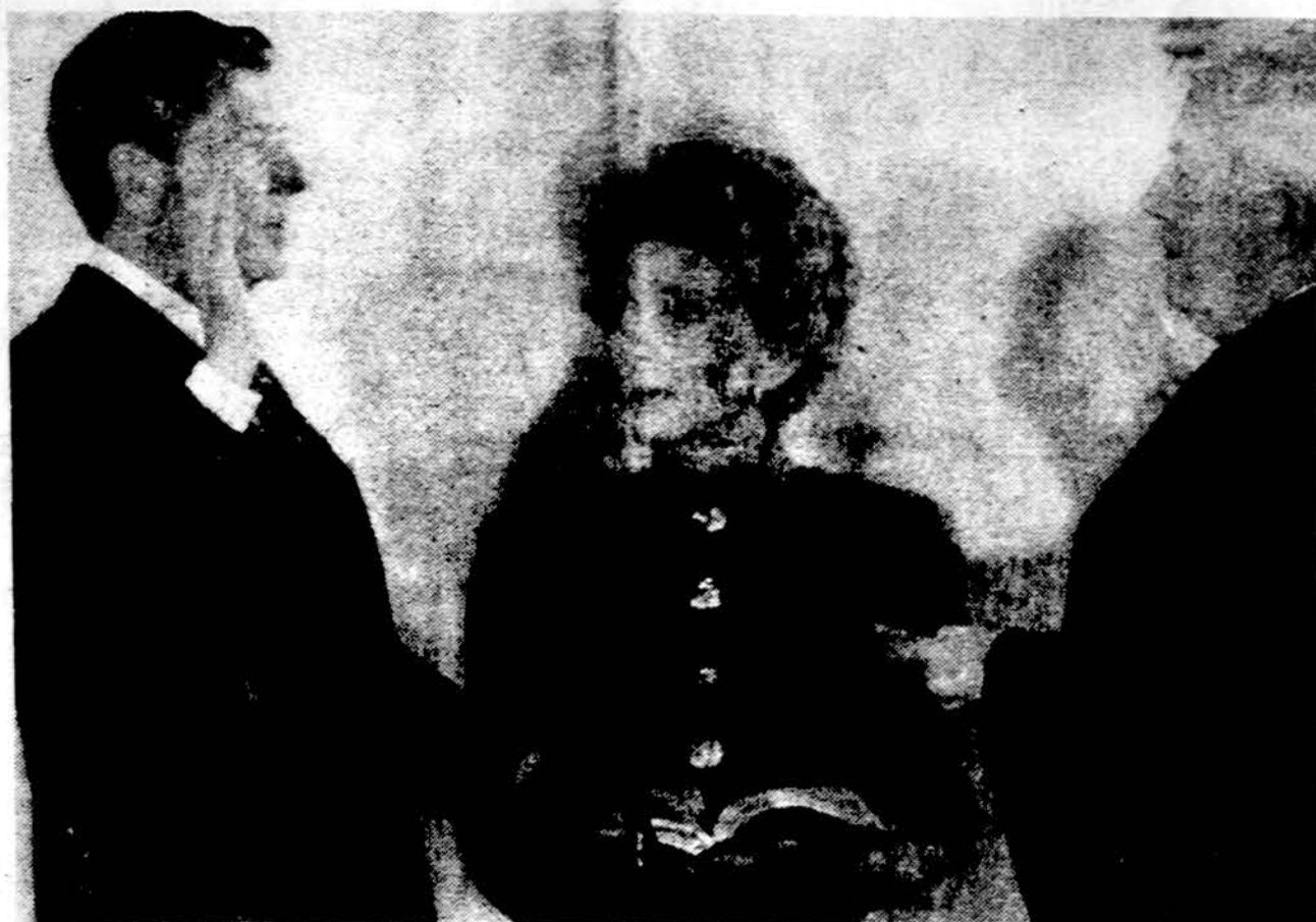
Prezidentas Reaganas pradeda savo antrąją kadenciją, kaip 40-tasis JAV prezidentas. Bibliją laiko ponis Nancy Reagan, o priesaiką priima Aukščiausiojo Teismo pirmininkas Warren E. Burger.

— JAV vyriausybė planuoja prašyti Kongreso padidinti Salvadoro vyriausybei skiriamą karinę ir ekonominę paramą.