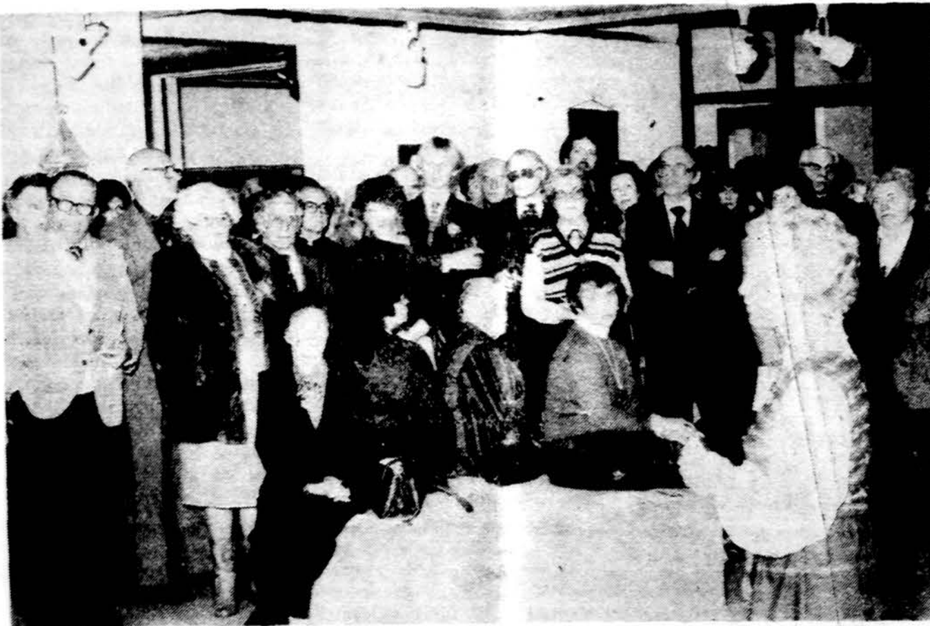
Tautinių dirbinių paroda atidarant Jaunimo centro Čiurlionio galerijoje dalis svečių.