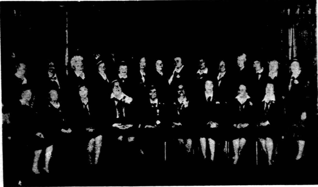
Chicagos skautininkų draugovė 1984 m. gruodžio 16 d. po vėliavos krikštynų.