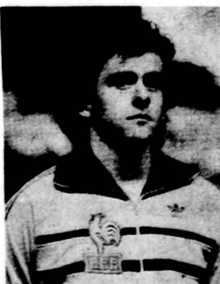
M. Platini, geriausias pasaulyje 1984 metų futbolo žaidėjas.

Meksikiečių pasiruošimai, tik 16 mėnesių prieš ten 1986 m. vyksiančias baigminių ratų žaidynes, jau toli pažengę. Turint omenyje, kad jie tam sutikimą gavo vos prieš dvejus metus, organizatoriai Meksikoje užsipelnė pagyrimo, kuris jiems buvo išreikštas po FIFA delegacijos inspekcijos. Naujo stadiono Quareto atidarymas yra papildomas įrodymas jų statybinės pažangos. Ne visi numatyti stadionai yra baigti, bet iki gruodžio mėnesio turėtų būti viskas užbaigta. Darbai būtų baigti pusmetį prieš Pasaulinių pirmenybių (1986) baigminių ratų varžybų pradžią.