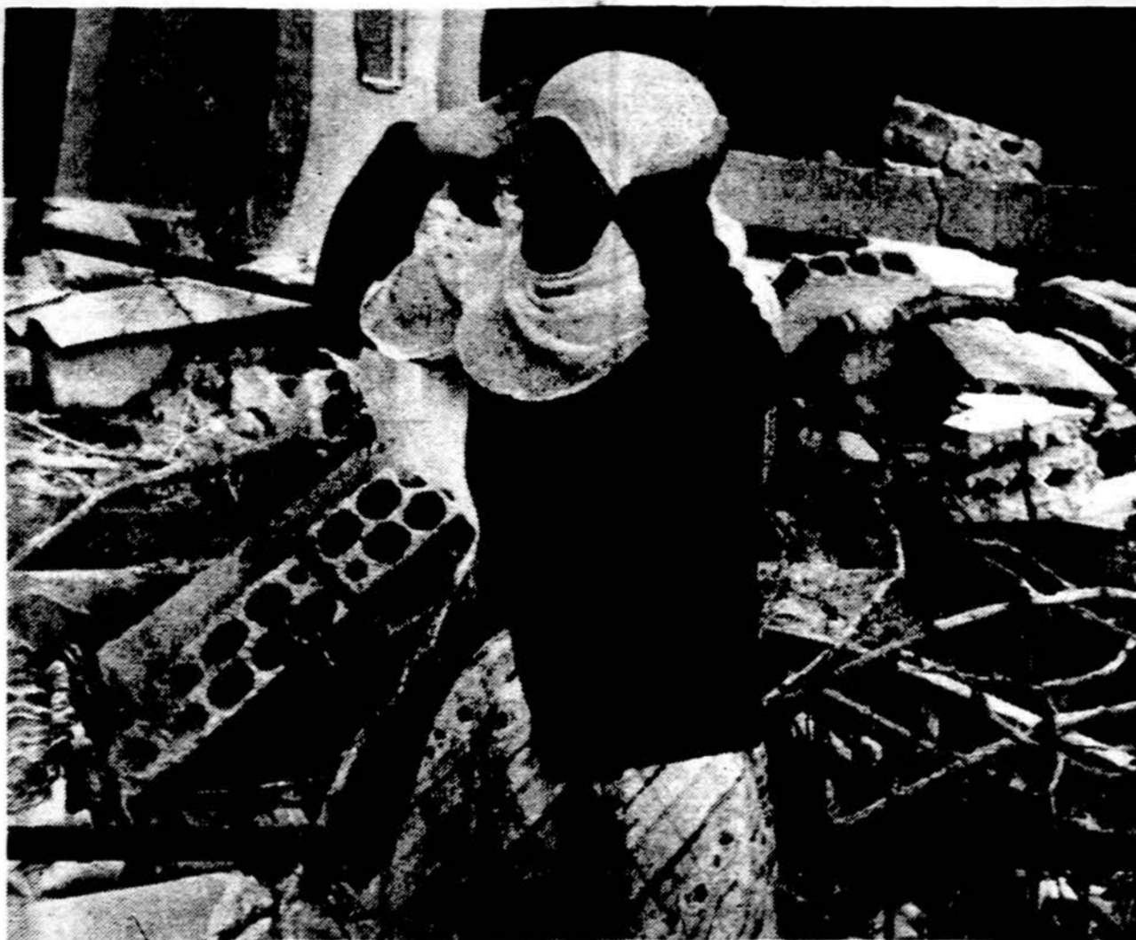
Israelio kariuomenė pietiniame Libane pasiuntė baudžiamąsias ekspedicijas į tris arabų kaimus, sugriovė 13 namų. Nuotraukoje moteris protestuoja dėl okupanto žygių.