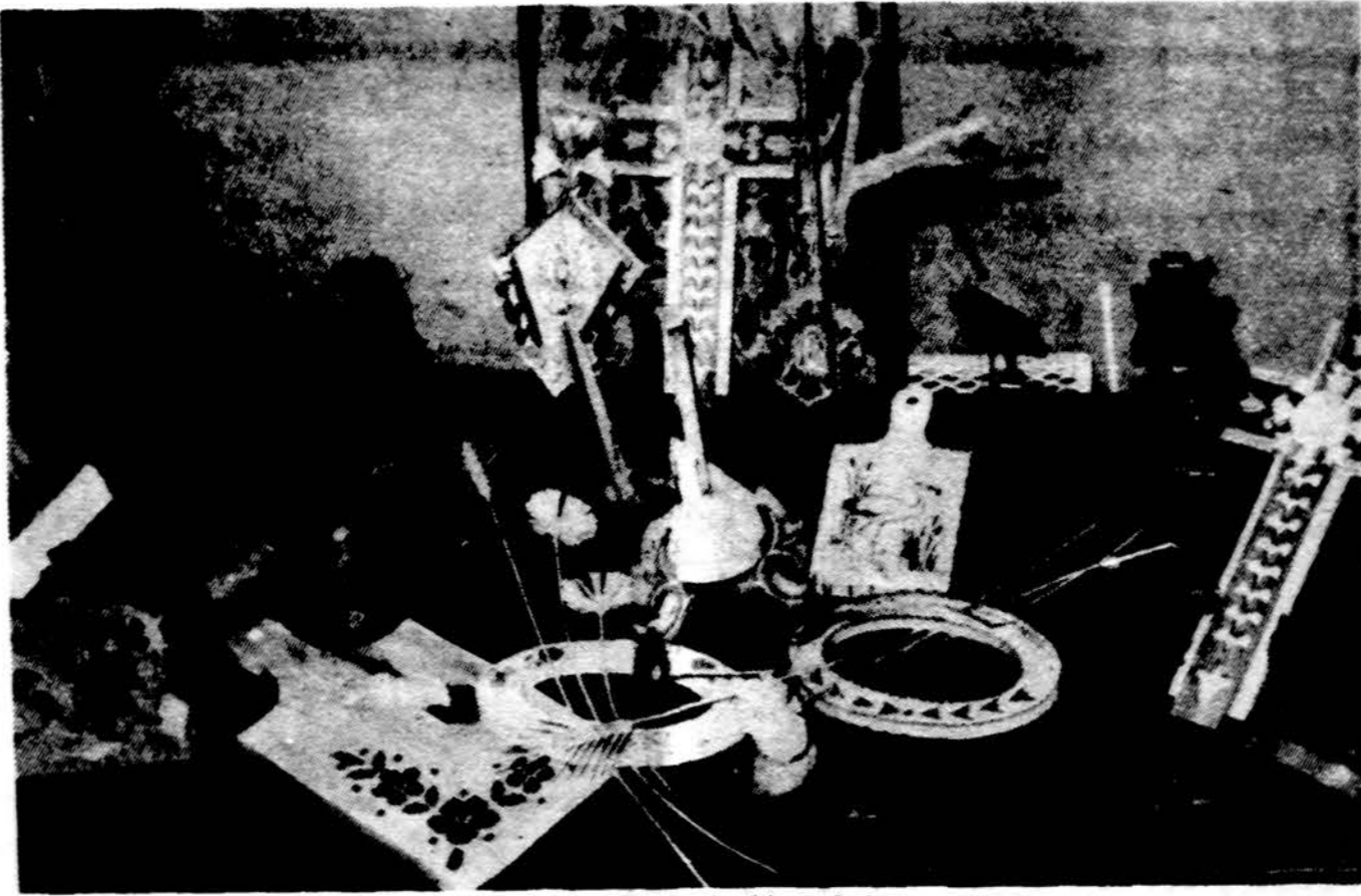
Darbėčių rankų sukurti muginukai Kaziuko mugėje laukia pirkėjų.