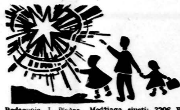
Redaguoja J. Plačas. Medžiagą siūsti: 3206 W. 65th Place, Chicago, IL 60629

x Nuperkame automobilius ir kitus daiktus gyvenantiems Lietuvoje ir padėdami sutvarkyti palikimus. Kreiptis į American Travel Service Bureau, 9727 S. Western Ave., Chicago, Ill. 60643. Tel. 312 238-9787. (sk.)