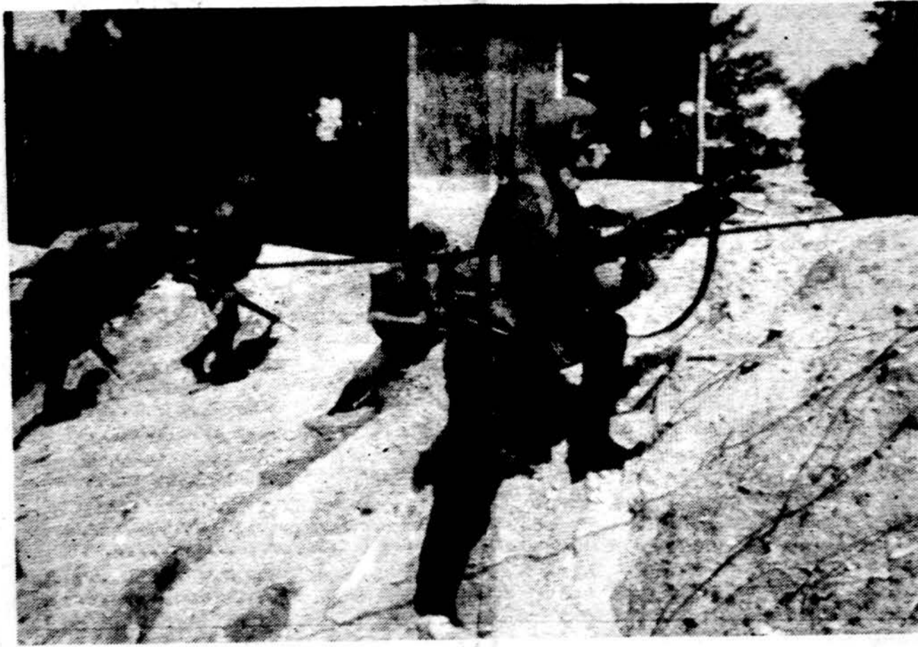
Izraeliui nelengva pasitraukti iš Libano. Partizanai puldinėja izraelietius, keliuose paslėpia minas, svaido Molotovo kokteilius. Okupantas jau surengė Tyro apylinkės kaimuose baudžiamąsias ekspedicijas, susprogdino daug namų, suėmė šimtus įtariamųjų. Libano vyriausybė pasiskundė dėl okupanto elgesio Jungtinėms tautoms.

Managva. — Nikaragvoje lankėsi JAV katalikų vyskupų konferencijos delegacija, nurykusi į Managvą išsiaiškinti padėtis. Delegacijoje buvo ir Chicagos arkivyskupas kardinolas Joseph Bernardin. Delegacijos vadovas New Yorko arkivyskupas John O'Connor pasakė, kad vyskupai neatstovauja JAV vyriausybei ir atvažiuo tik „pasiklausti“. Iš Nikaragvos vyskupai vyksta į Salvadorą. Penktadienį jie dalyvaus Centrinės Amerikos vyskupų konferencijoje, kur dalyvaus vyskupai iš šešių valstybių.