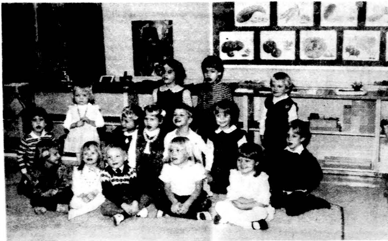
„Žiburelio“ Montessori mokyklėlės auklėtiniai po savo kūčių linksmai nusiteikę.

x Vyresnio amž. moteris iesko moters gyventi kartu. Marquette Parko apylinkėje. Salygos pagal susitarimą. Informacijai skambinti tel. 925-2009. (sk.)