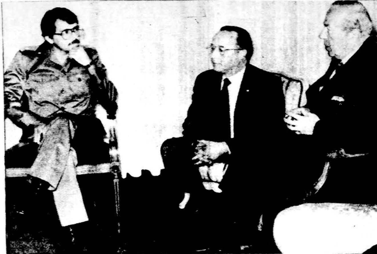
Urugvajaus sostinėje įvyko Nikaragvos prezidento Daniel Ortegos (kairėje) pasitarimas su valstybės sekretorium George Shultz. Viduryje — vertėjas. Ortega pareiškė, kad Nikaragva pageidauja atgaivinti pastovius abiejų šalių diplomatų pasitarimus, kurie padėtų išspręsti kylančius nesutarimus.

— Maskvon atvyko Kinijos Liaudies kongreso delegacija, kuri viešės 10 dienų.